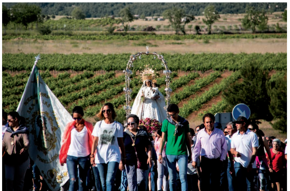
Traslado de la Virgen de las Viñas de Tomelloso a su santuario. 2 de junio de 2019

Este tiempo del «triunfo de la vida» que simboliza la primavera,