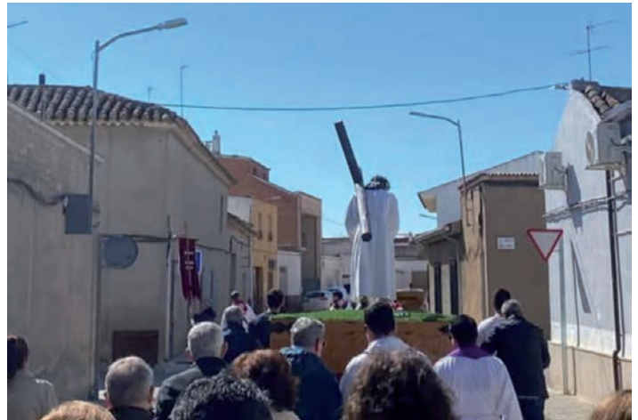
Procesión con la imagen de Jesús Pobre

La parroquia de Nuestra Señora de los Ángeles de Tomelloso vivió del 15 al 22 de marzo una semana de renovación misionera acompañada por el Equipo Misionero Vicenciano de Evangelización (EMVE), bajo el lema No es cuestión de tiempo, sino de encuentro . Una experiencia de fe marcada por la cercanía y la vida compartida, que impulsó a la comunidad a vivir una Iglesia «en salida».