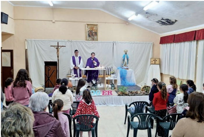
Eucaristía durante la misión

La parroquia de Nuestra Señora de los Ángeles de Tomelloso celebró del 15 al 22 de marzo una semana de renovación misionera acompañada por el Equipo Misionero Vicenciano de Evangelización (EMVE).