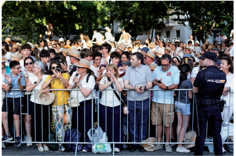
Algunas personas de nuestra diócesis esperando al Papa para la vigilia de oración en Madrid.

Según explican los participantes, el calor, las largas esperas, los controles de acceso y los desplazamientos en metro formaron también parte de la experiencia, pero coinciden en que esas incomodidades se convirtieron en ocasión para vivir la paciencia, la ayuda mutua y el sentido comunitario. Marcos Sevilla lo resume con