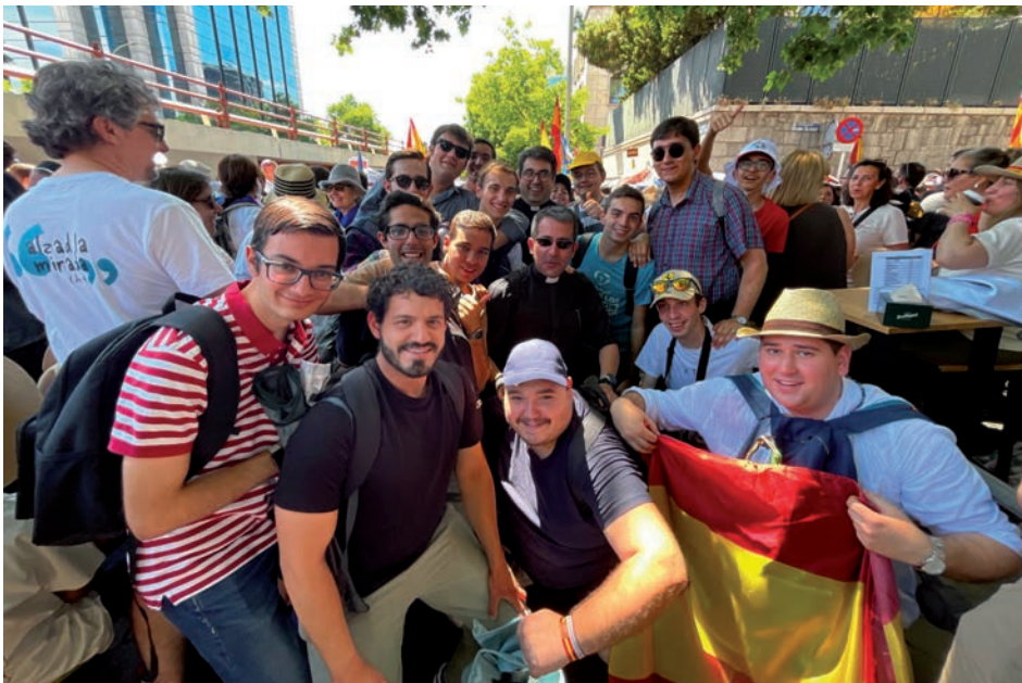
Los seminaristas de Ciudad Real esperando para la vigilia con el Papa

El programa previo incluyó conciertos y el rezo del rosario, con testimonios vocacionales entre misterio y misterio. Jorge destaca este detalle como una invitación a los jóvenes a preguntarse por la llamada de Dios y a responder con generosidad. Después, la llegada del Papa desató la emoción de los asistentes. «Sin ninguna duda, el mejor momento fue en el que vimos aparecer al Papa León entre cantos y muestras de cariño en la Plaza de Lima».