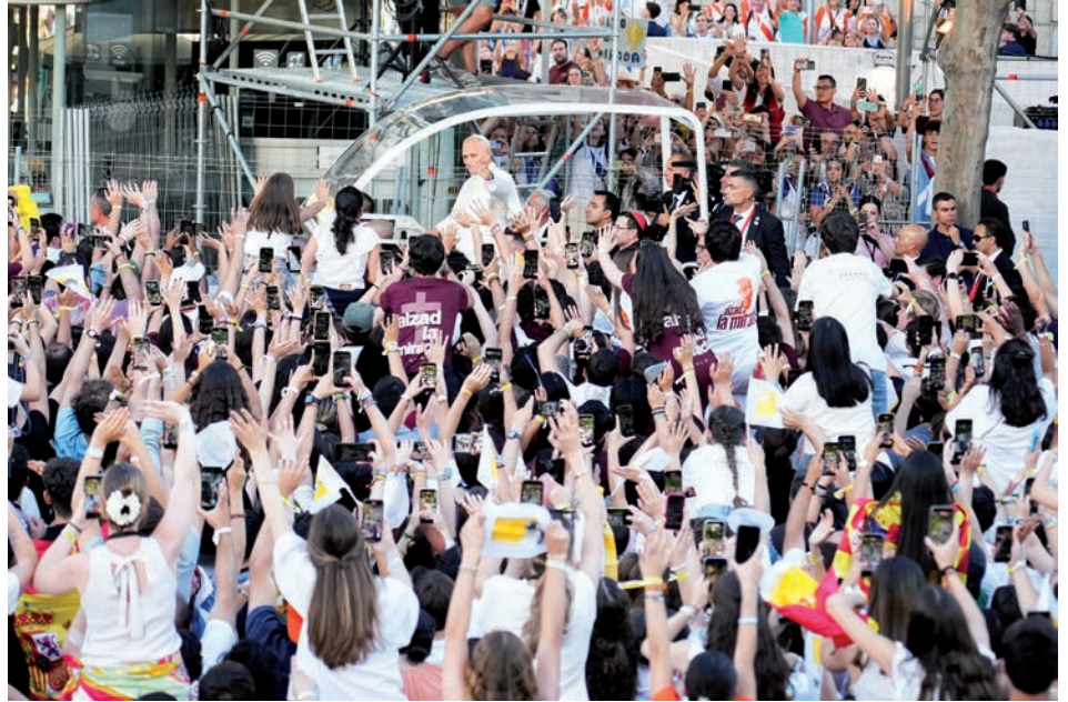
El papa León llegando a la vigilia de oración en Madrid.

Ese silencio ante el Santísimo fue, de hecho, uno de los momentos más mencionados por los participantes. Tras la alegría de los cantos y la emoción de la llegada del Papa,