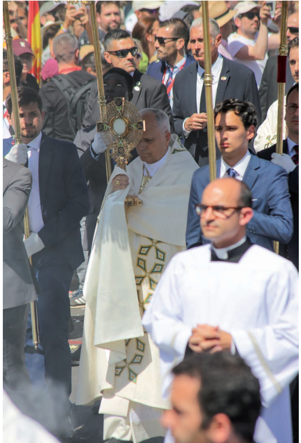
El Papa con el Santísimo durante la procesión del Corpus por Madrid. La misa fue una de las más multitudinarias de la historia

Por eso, resume su experiencia con una frase que ayuda a comprender lo vivido en Cibeles: «El Papa hace extraordinario lo ordinario». Para este laico de la diócesis, miembro de hermandades, la celebración permitió mirar de otra manera aquello que la Iglesia vive cada domingo, redescu-