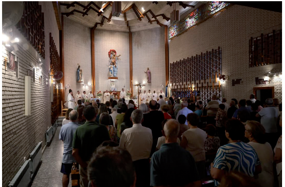
La iglesia del monasterio se llenó para la misa

Don Abilio destacó también el valor de la vida contemplativa en la Iglesia, especialmente en una jornada dedicada a la oración por los monjes y monjas de clausura. Subrayó que las comunidades contemplativas