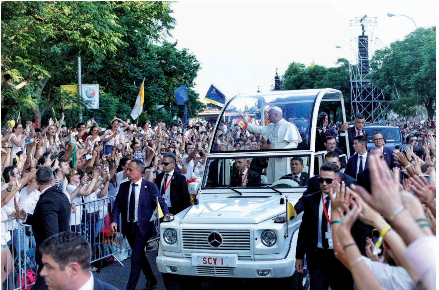
El papa León llegando a la celebración de la vigilia en Madrid el 6 de junio de 2026.

La diócesis de Ciudad Real vivió en Madrid una jornada histórica con motivo de la visita apostólica del papa León XIV a España. Más de 1.500 peregrinos participaron en los actos, especialmente en la vigilia con jóvenes de la Plaza de Lima.