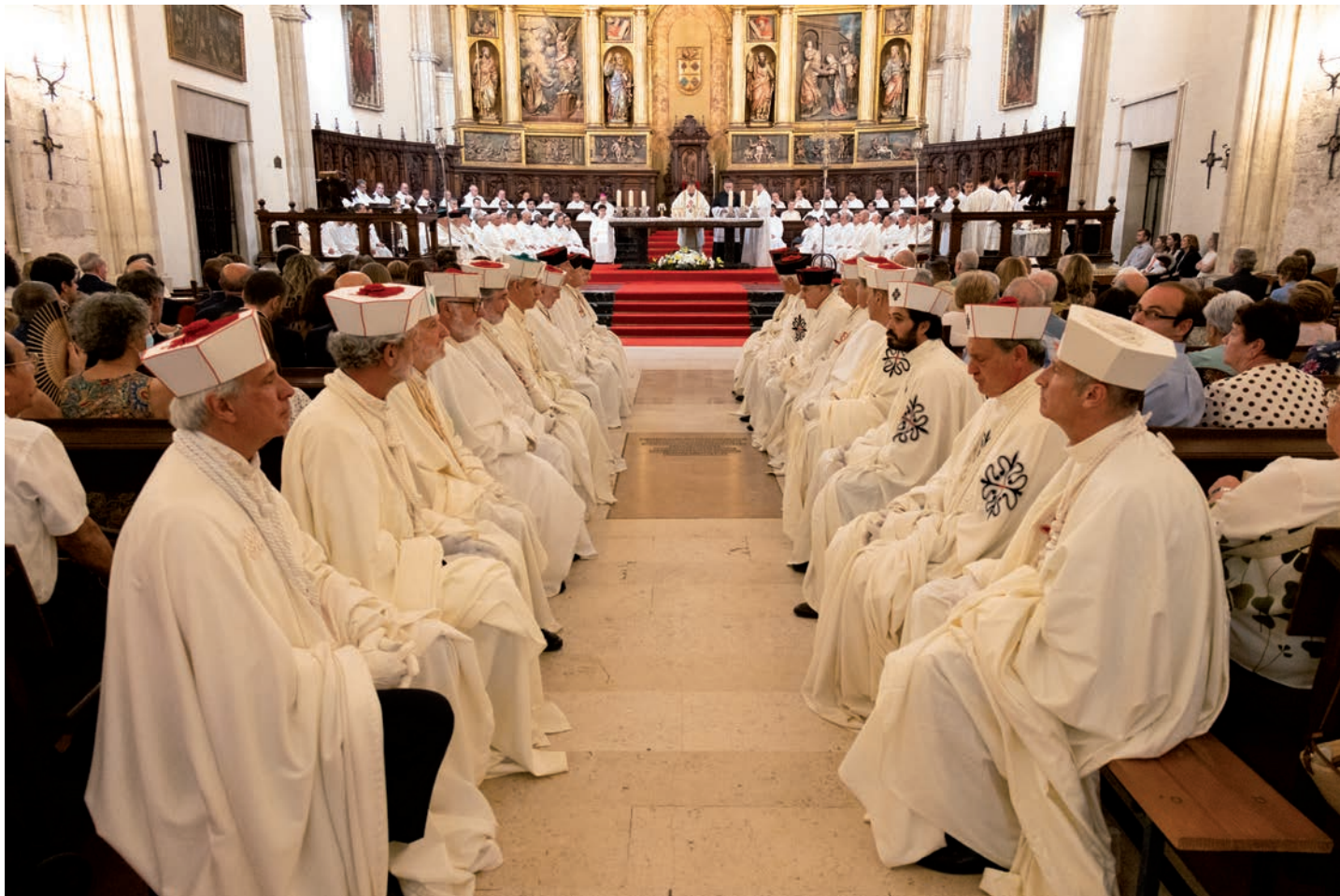
Los caballeros de las Órdenes Militares en la vía sacra de la catedral

que este pasaje permite interpretar la historia del Obispado Priorato no solo como «una curiosidad» o «una mera institución con curiosidades históricas», sino como la historia de una Iglesia llamada a permanecer unida a Cristo para dar fruto.