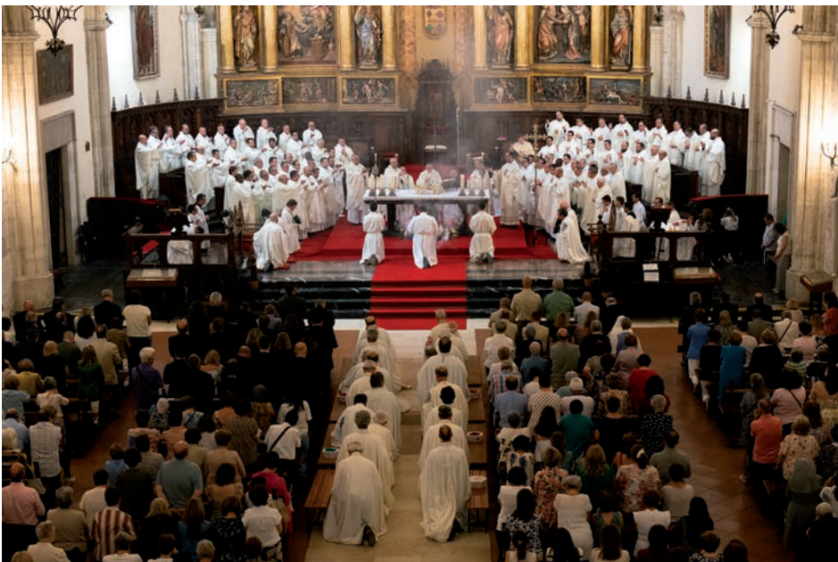
Un momento de la eucaristía en la catedral

«Agradecer es una virtud cristiana – dijo –. Pero no basta con recordar nuestros logros que hemos conseguido, las virtudes que hemos tenido hasta ahora, sino preguntarnos qué espera hoy el Señor de nosotros como Iglesia que peregrina en Ciudad Real». Desde esta clave, invitó a la diócesis a vivir el aniversario no como una mirada cerrada al pasado, sino como una llamada a renovar la misión.