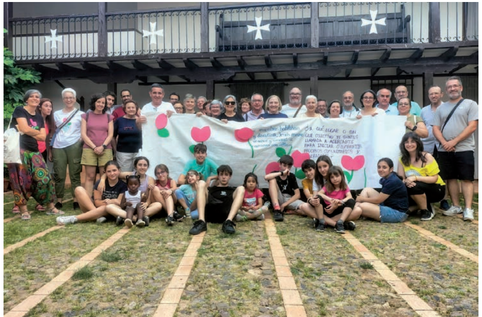
Participantes de las diócesis de Ciudad Real y Toledo en el encuentro

Por la tarde, los niños y jóvenes de las familias asistentes tuvieron especial protagonismo, puesto que algunos de ellos se están iniciando