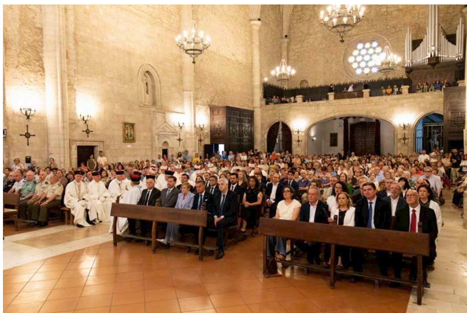
La catedral se llenó con fieles de toda la provincia