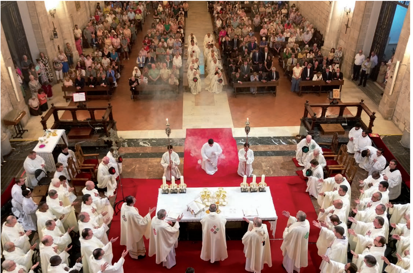
Consagración durante la misa en la catedral.