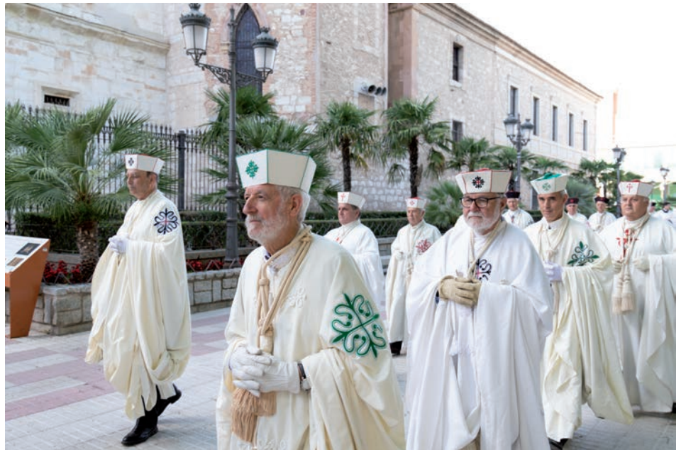
En la celebración participaron 24 caballeros de las Órdenes Militares

Preguntado por el momento que vive la Iglesia diocesana, el obispo señaló que, tras meses como pastor de Ciudad Real, vive este tiempo como «un momento de alegría, de entusiasmo y de esperanza». «Estoy conociéndola —dijo—, entrando en comunión con las diversas reali-