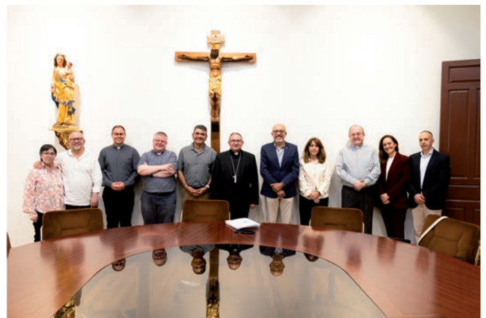
Responsables de los Equipos y consiliarios junto al obispo