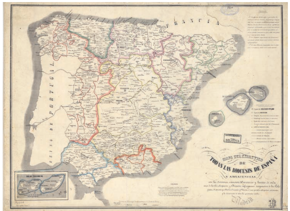
Mapa eclesiástico de todas las diócesis de España (1838-1858).

«Al comenzar el siglo XIX España presentaba una de las más abigarradas divisiones territoriales eclesiásticas que imaginarse pueda»