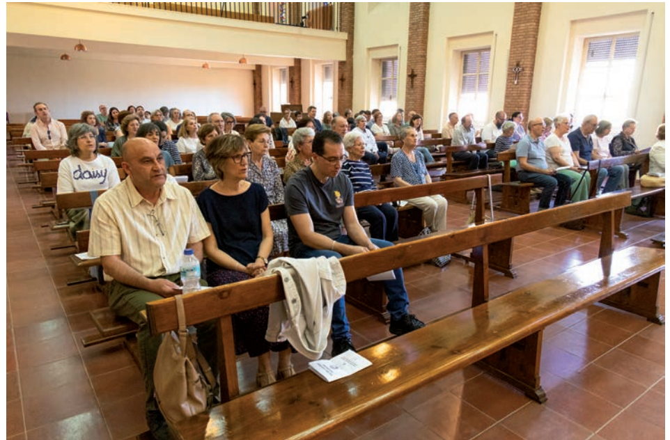
Algunos de los participantes en el encuentro durante la eucaristía en la capilla mayor del Seminario

El encuentro estuvo organizado por varias delegaciones diocesanas: Apostolado Seglar, Pastoral Familiar, Pastoral de Juventud, Hermandades y Cofradías, Pastoral Universitaria, Pastoral Obrera y Pastoral de Educación. La celebración se enmarcó,