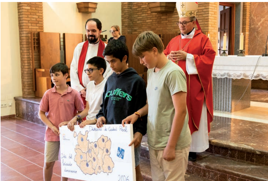
Durante la misa, algunos niños participantes en el encuentro presentaron al obispo un mapa de la diócesis

El obispo concluyó animando a los fieles laicos a vivir con paz, gozo y alegría la vocación recibida en el bautismo. Aunque reconoció que son muchas las dificultades para ser testigos en el mundo, recordó que los cristianos cuentan con la ayuda del Espíritu Santo. «Tengamos un corazón dispuesto, un corazón gozoso, para dar testimonio de Jesús en el mundo, ayudados por el Espíritu Santo», afirmó.