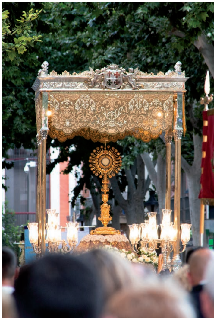
Un momento de la procesión del Corpus de la capital el pasado año 2025

En el mismo sentido, hizo referencia al mensaje de los obispos para este Día de Caridad, centrado en la llamada a «alzar la mirada». Explicó que alzar la mirada a Cristo significa también aprender a contemplar la realidad de los pobres y de las personas heridas por la exclusión, la soledad o la falta de oportunidades. También destacó la importancia de trabajar por la paz, recordando las primeras palabras del Papa desde el balcón de la basílica de San Pedro: «La paz sea con todos vosotros».