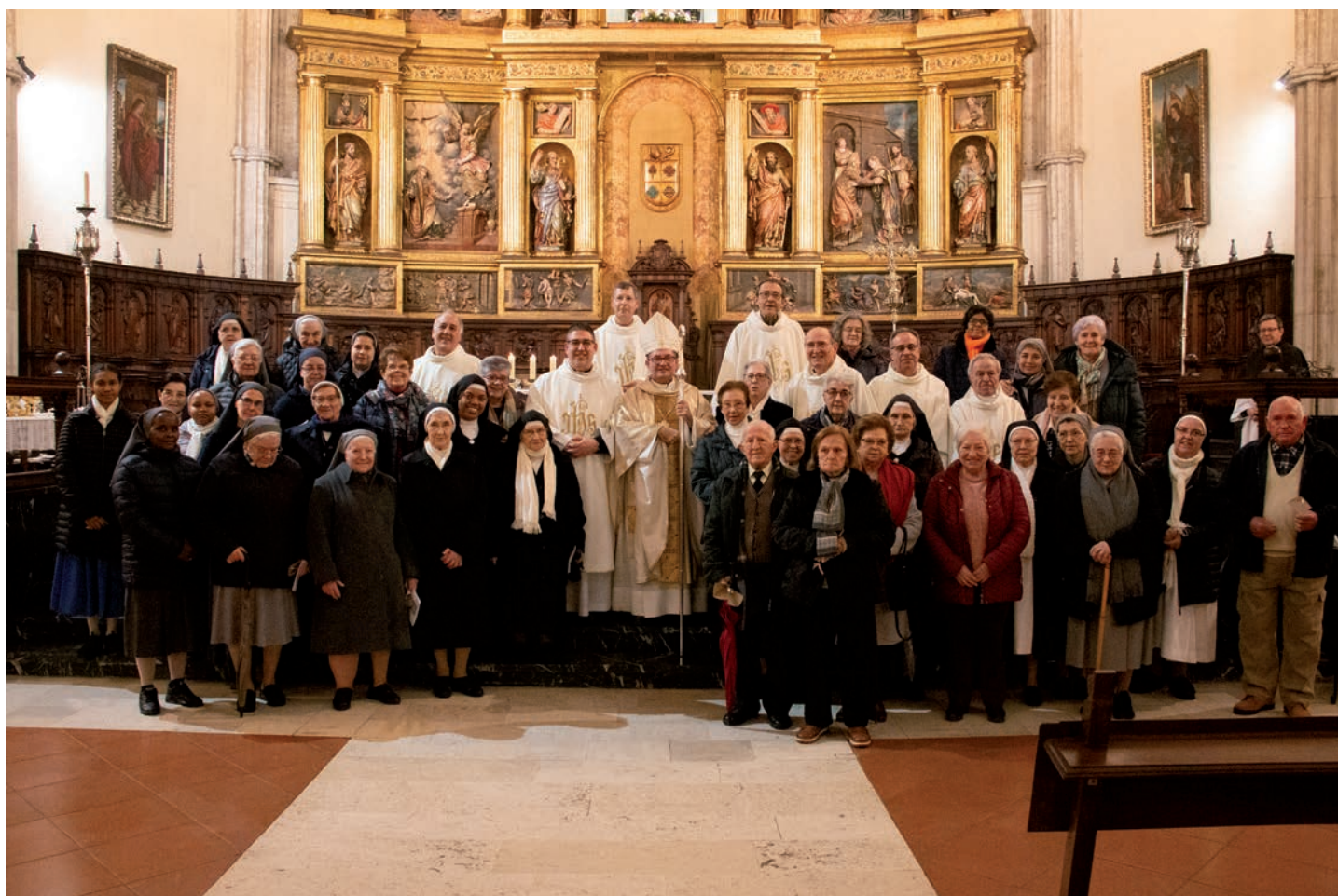
Los religiosos que participaron en la misa junto al obispo al final de la celebración

El 1 de febrero se celebró en la catedral la Jornada Mundial de la Vida Consagrada, que este año alcanzaba su trigésima edición con el lema ¿Para quién eres?, en sintonía con el Congreso de Vocaciones de febrero de 2025. La misa, en el marco de la fiesta de la Presentación del Señor, estuvo presidida por el obispo y reunió a numerosos religiosos y religiosas, que renovaron sus votos en una celebración marcada por el signo de la luz.