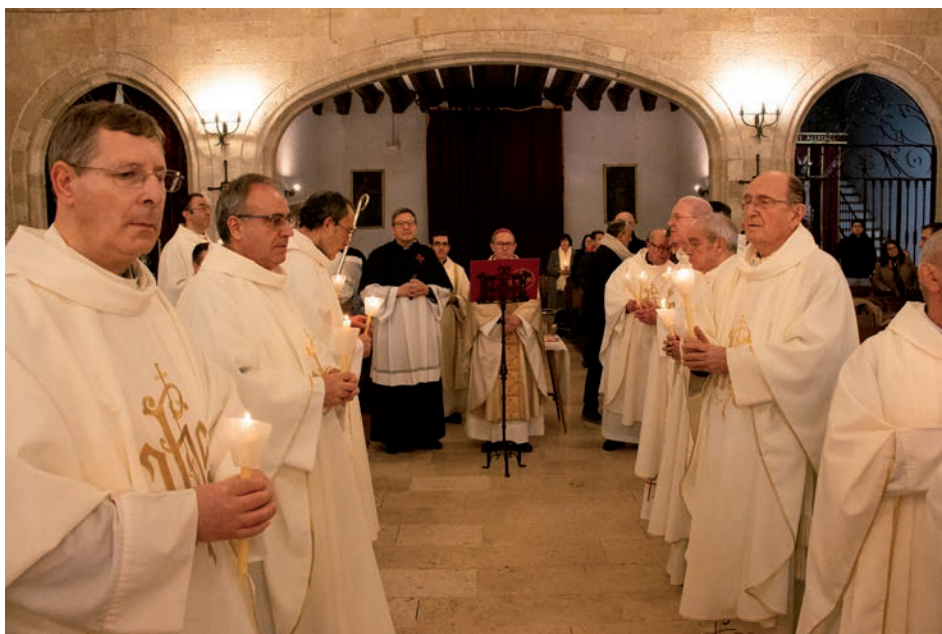
Un momento del comienzo de la celebración con el encendido y bendición de las candelas

El obispo se detuvo especialmente en la identidad de la vida consagrada, recurriendo a la exhortación apostólica Vita consecrata de san Juan Pablo II, donde se afirma que «la vida consagrada es una planta que hunde sus raíces en el evangelio y que da frutos copiosos a lo largo de la historia de la Iglesia». Esta imagen, explicó, indica que la vida consagrada «tiene sus raíces en el evangelio, es decir, hunde