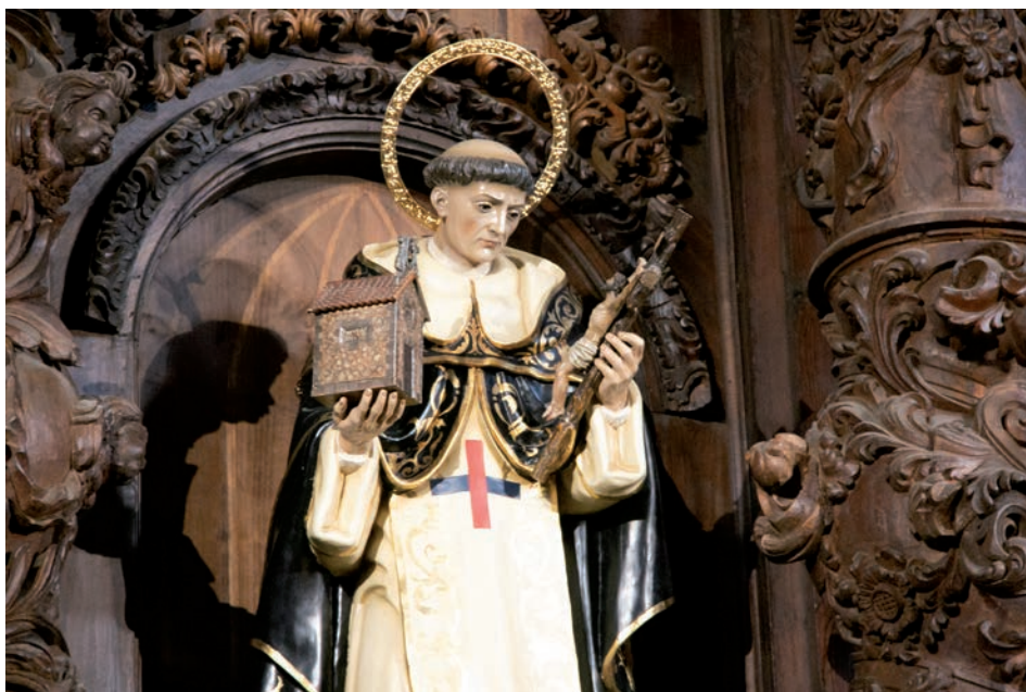
Imagen de san Juan Bautista de la Concepción en el retablo de Almodóvar del Campo

Después de esta experiencia, Juan Bautista viajó a Roma para presentar su proyecto de reforma al papa Clemente VIII, quien aprobó la «Congregación de los hermanos reformados de la Orden de la Santísima Trinidad». La humildad y austeridad de la Orden hizo que fueran llamados «Trinitarios descalzos», frente a los calzados, rama que se extinguiría en el siglo XIX.