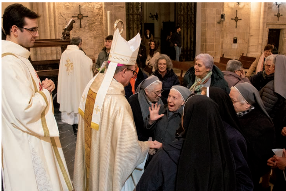
El obispo saluda a algunas de las religiosas al final de la celebración

Después de la homilía, todos los consagrados renovaron los votos, con la mirada puesta en María, ejemplo de acompañamiento, ayuda y esperanza para todos los cristianos.