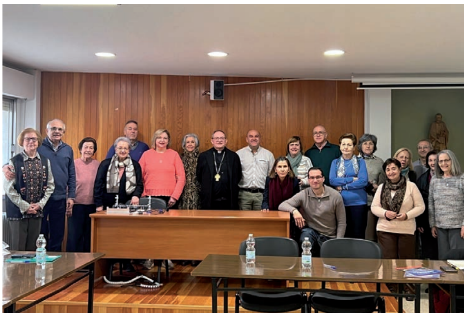
Foto de los participantes con el obispo

Entre los temas que se van a trabajar de manera específica, destaca el delegado, está «el itine-