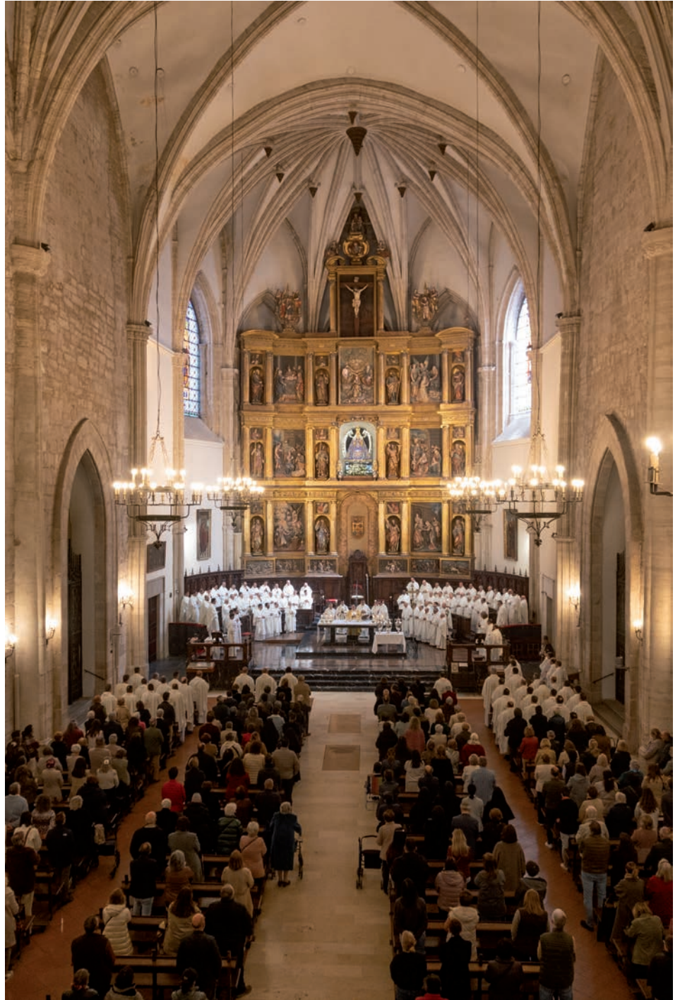
La catedral se llenó para la celebración de la Misa Crismal

La jornada comenzó antes, en la parroquia de Santa María del Prado, donde los sacerdotes celebraron un acto penitencial, recibiendo el sacramento de la reconciliación. Desde allí se encaminaron hacia la catedral para participar en esta misa singular que, siendo propia del Jueves Santo, se adelanta en Ciudad Real al Miércoles Santo para facilitar la participación de sacerdotes y fieles.