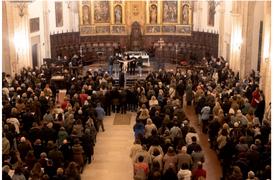
La catedral se llenó con la participación de más de mil personas en la oración del viacrucis

Don Abilio pidió a todos que el gesto exterior del viacrucis se convirtiera también en una vivencia interior de fe: «Os pido que ahora llevemos al Señor en el corazón. Que llevemos realmente a