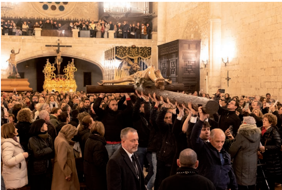
Entrada del Cristo de la Buena Muerte en la catedral

La celebración concluyó con la bendición impartida por el obispo a todos los asistentes, poniendo fin a una noche de recogimiento y oración en torno a la cruz del Señor.