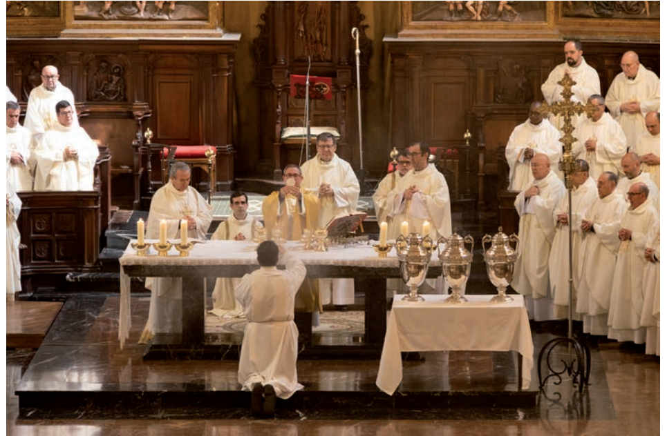
Un momento de la Misa Crismal

A partir del pasaje del evangelio de san Lucas en el que Jesús