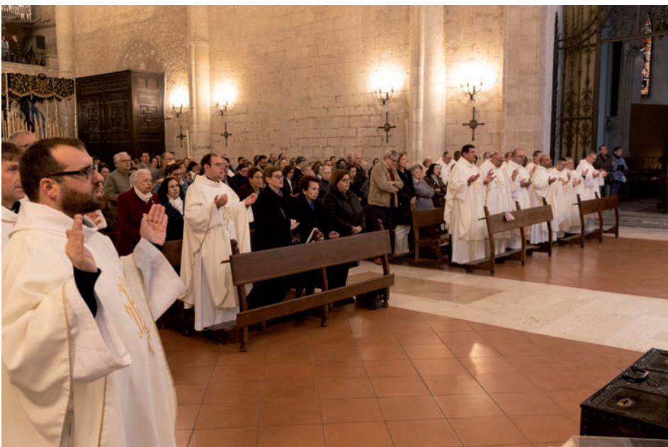
La Misa Crismal expresa la comunión de toda la diócesis

Apoyándose en Evangelii gaudium , recordó también que el pastor está llamado a ir delante del