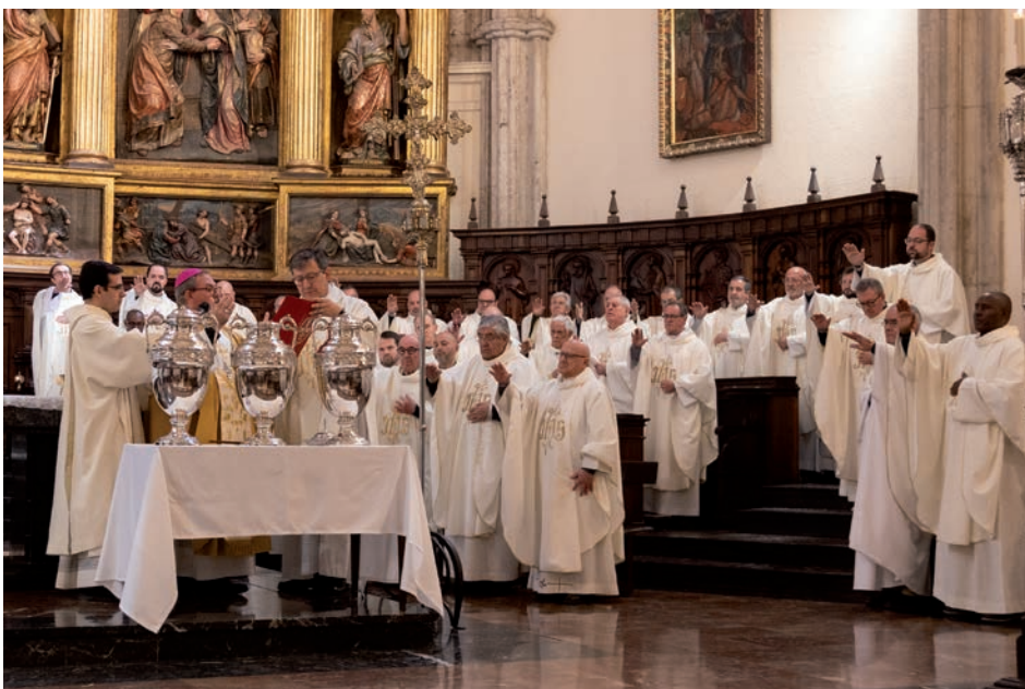
Consagración del santo crisma

De este modo, la Iglesia de Ciudad Real vivió el 1 de abril, Miércoles Santo una de las celebraciones que mejor expresan su rostro diocesano: una Iglesia reunida en torno a su obispo, con sus sacerdotes, seminaristas, consagrados y laicos, para pedir la gracia de p e r m a - necer unida a Cristo y de seguir llevando su consuelo, su fortaleza y su salvación a todos.