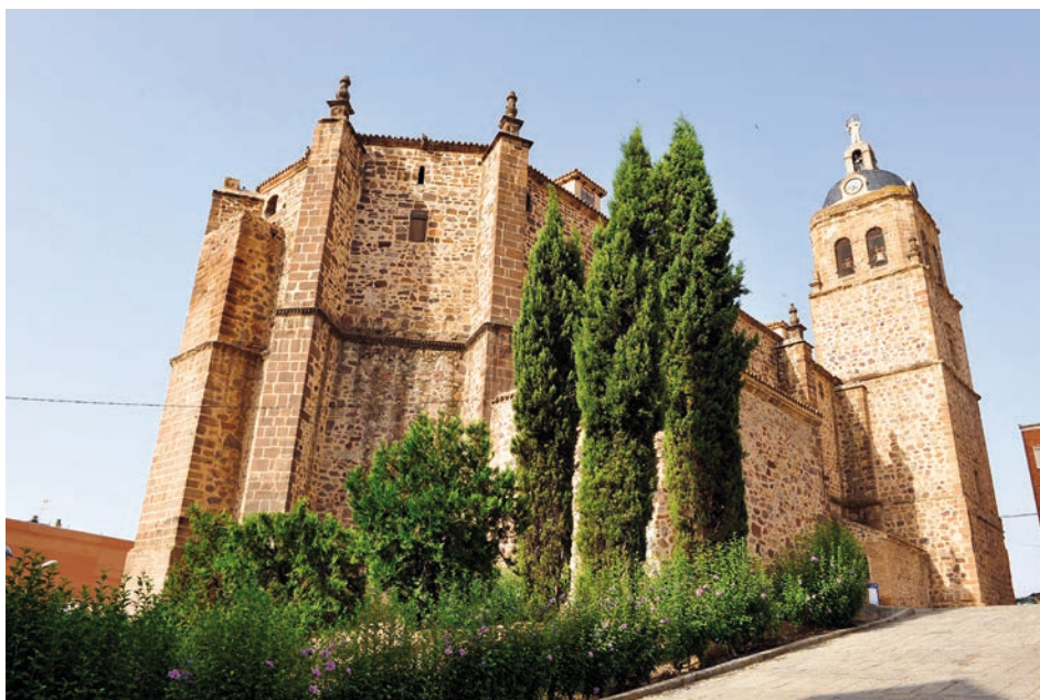
Exterior del templo de Ntra. Sra. de La Asunción de Puertollano

El primer testimonio que tenemos acerca de la actual iglesia lo localizamos en una «visita de Calatrava» fechada en 1537. Por este documento, conocemos que la obra estaba a cargo de Alonso de Escuderos, vecino de Yepes. En 1577,