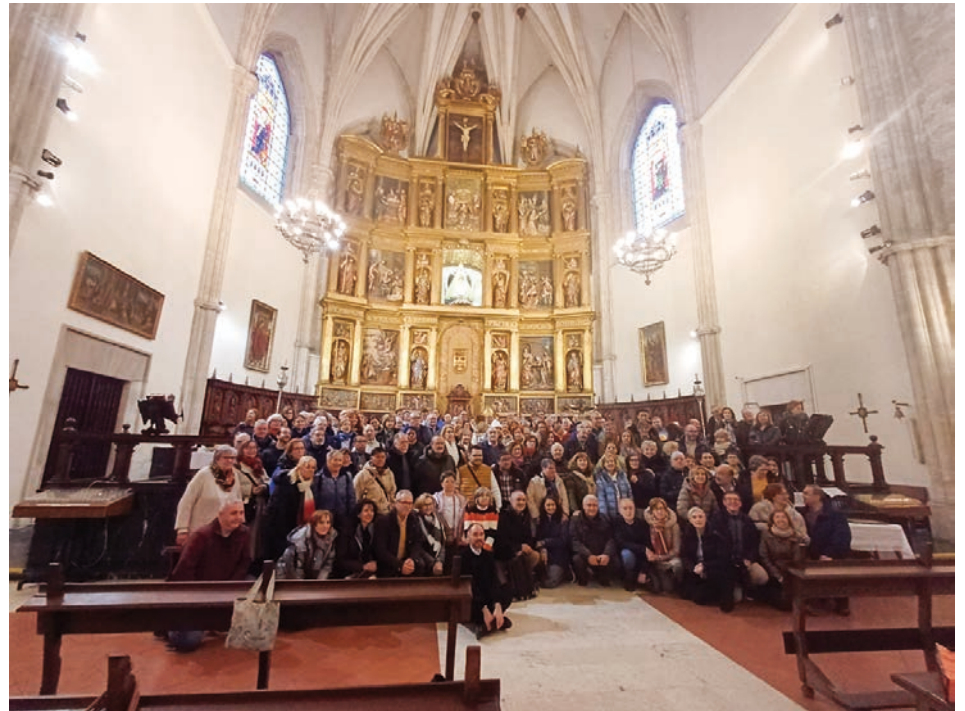
Cerca de 200 cursillistas participaron en el encuentro

tiandad en la que desgranó el peregrinar pastoral y espiritual de Juan Hervás junto a otros sacerdotes y seglares. Destacó su empeño y misión a través de los Cursillos, sin descuidar la novedosa metodología propia que surgió a través de ellos y que tantas conversiones ha provocado a lo largo de los años.