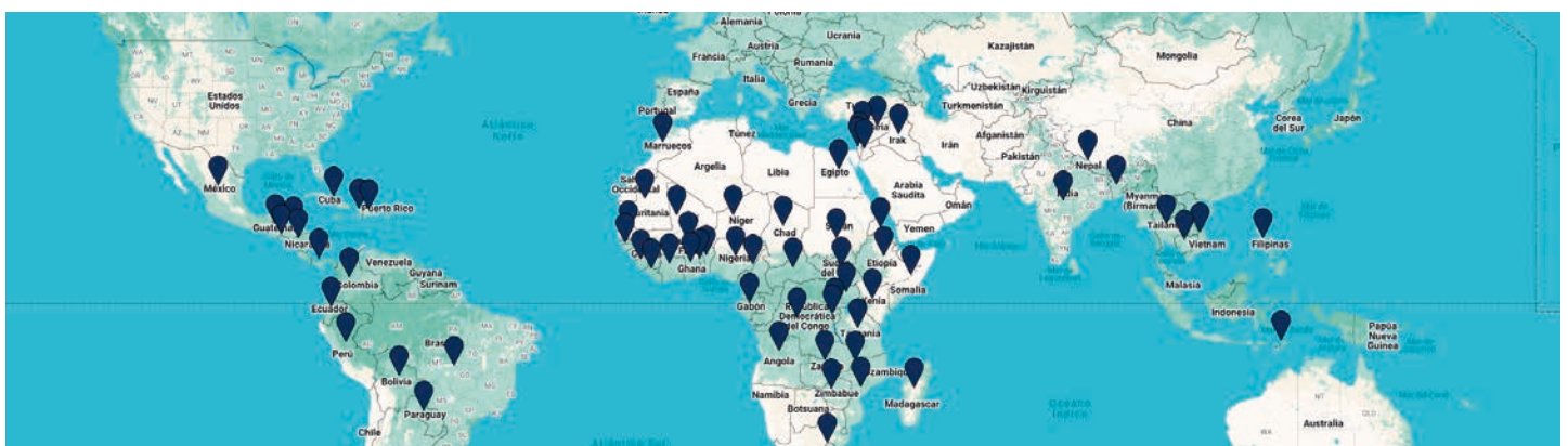
Proyectos de Manos Unidas en el mundo