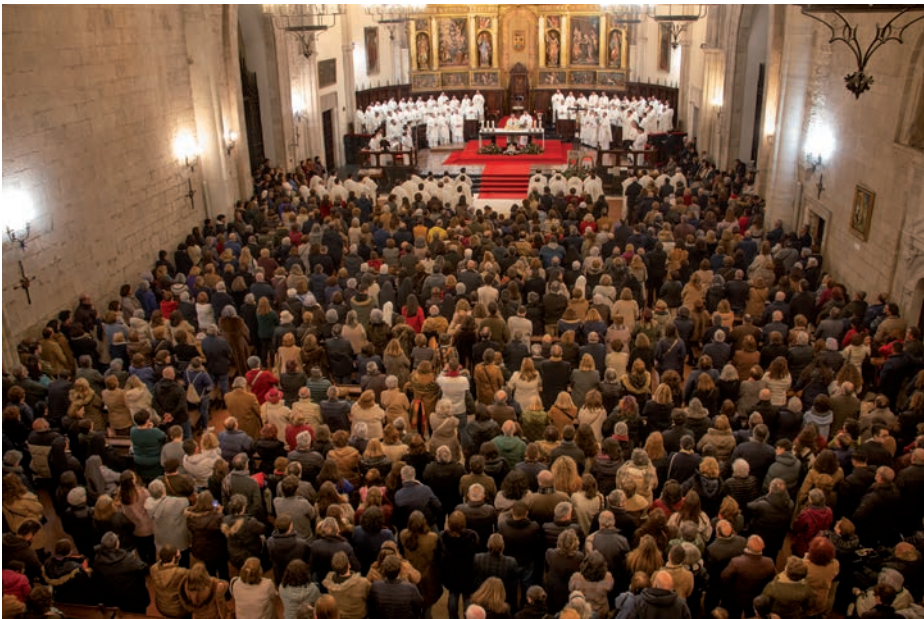
Misa de inauguración del Jubileo en la diócesis el 29 de diciembre del pasado año 2024

La colecta de la misa será la última realizada como signo solidario en los diferentes lugares jubilares. El signo se destinará en parte a Cáritas y en parte al programa de