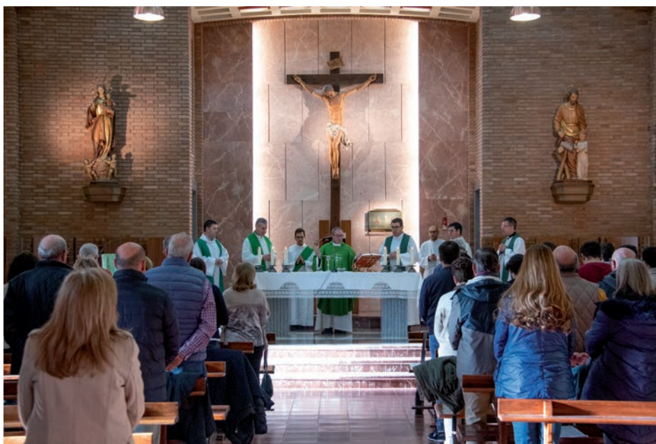
La asamblea comenzó con la eucaristía, que presidió el obispo en la capilla mayor del Seminario

En este sentido, el obispo subrayó la urgencia de trabajar por la concordia en todos los ámbitos: «No habrá desarrollo si no hay paz», afirmó, llamando a no olvidar que la verdadera paz «comienza en el corazón de cada uno». También animó a los miembros de Manos Unidas a perseverar en la tarea que llevan a cabo: «Os animo a que con el Espíritu Santo sigáis [...] buscando la paz y el desarrollo para que realmente esta paz esté presente en cada uno de nosotros».