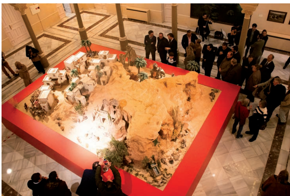
El nuevo belén de la Diputación el día de su bendición

El obispo bendijo el belén tras dirigir unas palabras, subrayando que estas expresiones artísticas iluminan el camino hacia la Navidad: «Hacéis posible que el tiempo previo a la Navidad brille, nunca mejor dicho, a través de las luces que nos recuerdan un gran acontecimiento». Recordó que el belén pertenece a la tradición cristiana y que «está puesto para recordar aquel gran acontecimiento que fue el nacimiento de Dios». Además, deseó para todos los habitantes de nuestra