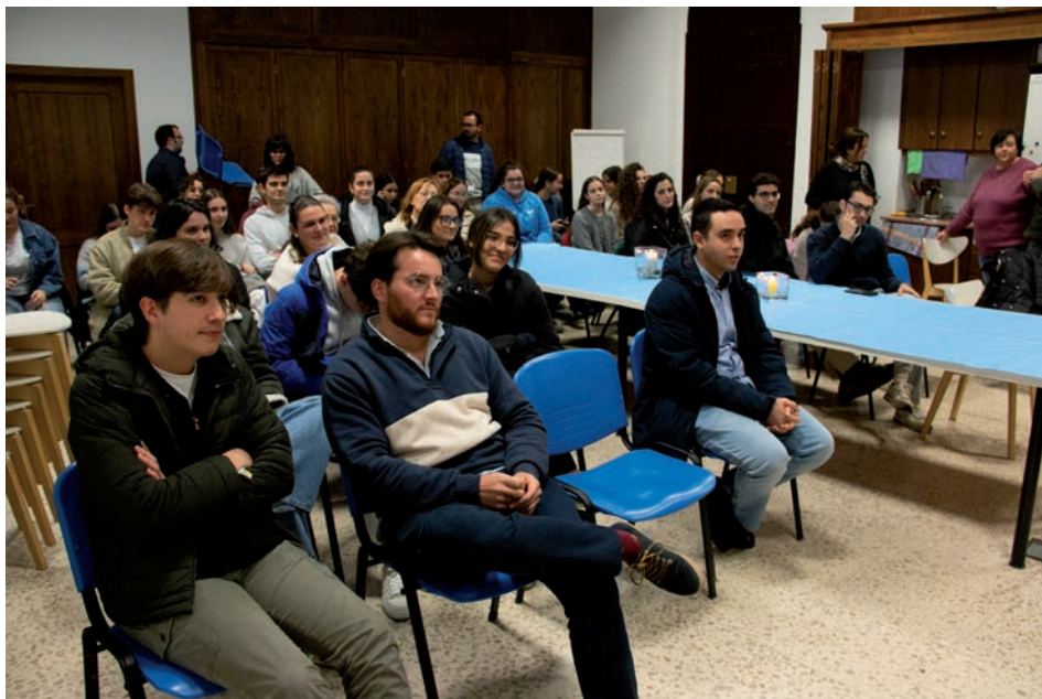
Después de la misa y la oración, el grupo de Pastoral Universitaria se reúne cada lunes en el centro juvenil San Juan Pablo II.

El obispo recorrió su vida de fe desde sus primeros pasos en su pueblo natal, Autol, en La Rioja. Allí, en el seno de su familia, la