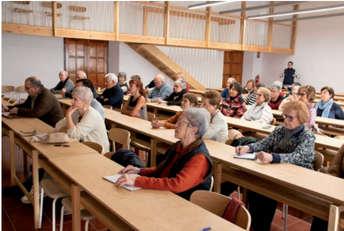
En torno a cincuenta personas participaron en el encuentro, que tuvo lugar en el Seminario

El Seminario Diocesano acogió el pasado 22 de noviembre el VIII Encuentro Cristianos discípulos del siglo XXI, una jornada formativa organizada por la Delegación de Apostolado Seglar que reunió a medio centenar de personas para profundizar en su misión y en la importancia de la presencia cristiana en la vida pública.