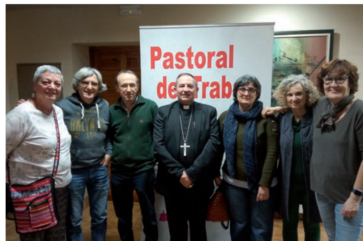
El grupo de Ciudad Real junto al obispo

Uno de los temas abordados fue el reto de extender la Pastoral del