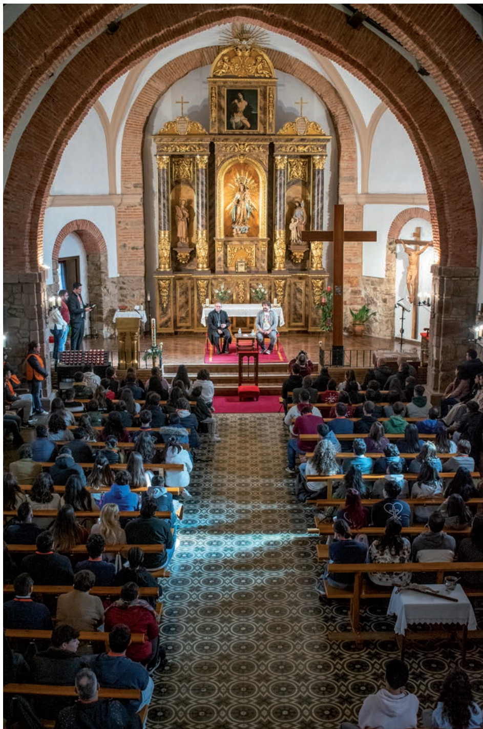
Jóvenes en el templo de San Sebastián de Porzuna al inicio de la Marcha.

El objetivo de la Marcha de Adviento, explicó también Marcos Sevilla, es el mismo desde que se comenzó a celebrar: ayudar a los jóvenes a preparar la Navidad con el Adviento, rezar juntos, aprender y convivir buscando que la