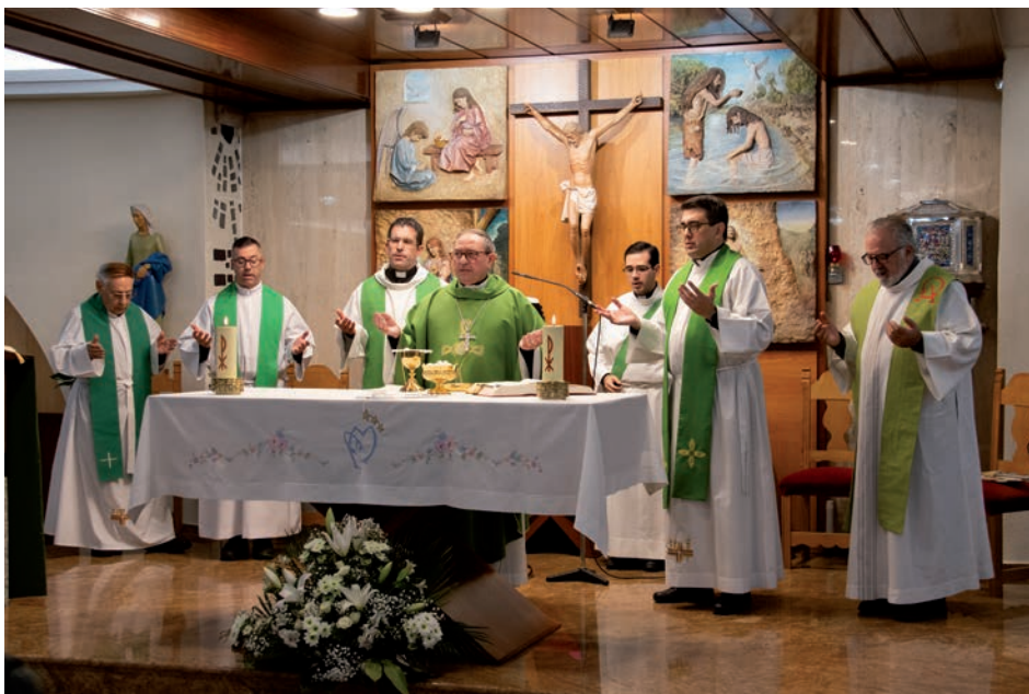
En la misa concelebraron algunos sacerdotes de parroquias con grupos de Vida Ascendente

El obispo presentó en una mirada bíblica y cristiana hacia la edad avan-