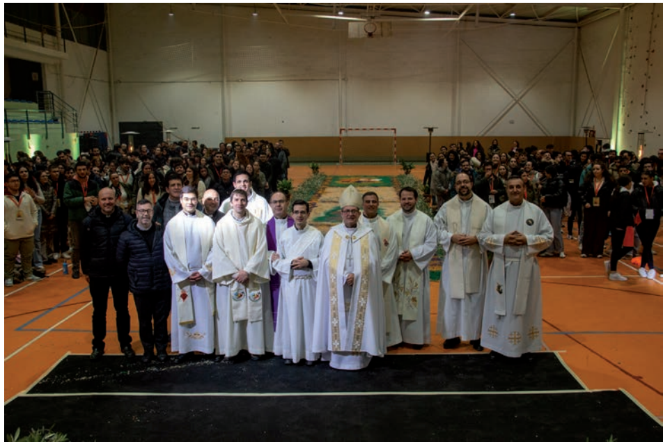
El obispo, junto a sacerdotes y los jóvenes participantes al final de la vigilia

Tras la lectura de la Palabra, el obispo hizo una invocación al Espíritu Santo para que «renueve la cara de mi vida ante el espejo de la Palabra» y sea «mi guía y mi aliento, mi fuego y mi viento, mi fuerza y mi luz».