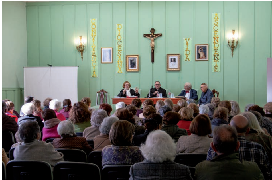
El obispo habló en su intervención de Los mayores en la Iglesia, haciendo hincapié en que son un don para todas las comunidades