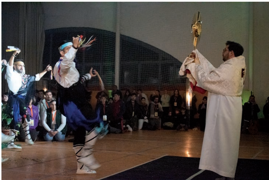
Danzantes ante la custodia al final de la vigilia.

Precisamente a los danzantes se refirió el obispo en la despedida, sintiéndose emocionado por «esta tradición preciosa» y por cómo se «han arrodillado haciendo la genuflexión ante el Señor». Aprovechando esto, pidió a los jóvenes hacer «también la genuflexión ante el Señor y ponerse de rodillas ante los pobres. Tenemos también que arrodillarnos ante el anciano, ante el enfermo, ante el que no llega al fin de mes, porque el Señor también está presente en los que lo pasan mal. Que tengáis feliz Santa Adviento y Feliz Navidad», concluyó.