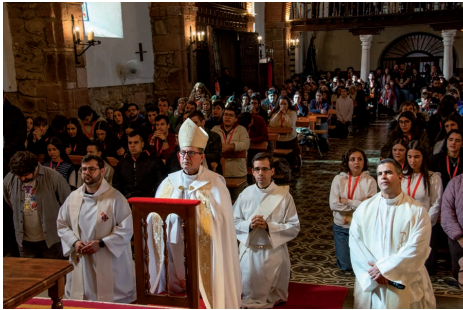
El obispo reza junto a los jóvenes ante el sagrario en la iglesia de San Sebastián de Porzuna

de la Conferencia Episcopal Española. Calificó la Marcha de Adviento —en la que no había participado, pero que conocía desde hace años— como un refuerzo en «el calendario que vamos provocando en las diferentes actividades de pastoral con jóvenes, para que la relación con el Señor vaya creciendo y vaya sumando enteros». El director de Juventud insistió en la importancia de este tipo de actividades extraordinarias que «provocan el encuentro con Dios», pero «que nos llevan a la parroquia, [...] donde los jóvenes son protagonistas, punta de lanza, donde los jóvenes tienen que liderar los procesos de pastoral en las parroquias, donde los jóvenes tienen que aportar esa transparencia, esa frescura y esa luz para ser realmente la llama de Cristo».