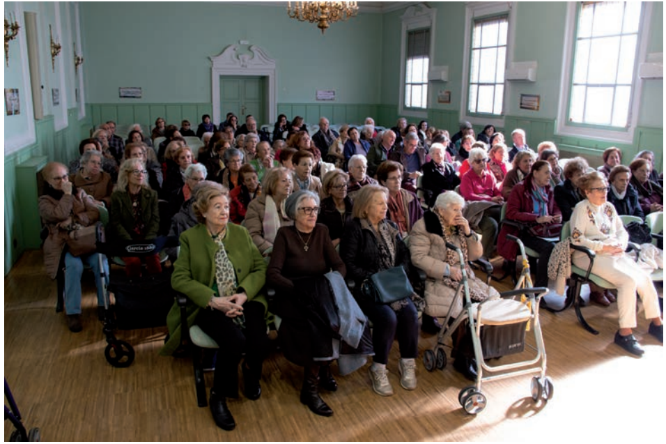
El grupo de Vida Ascendente que se reunió para la convivencia. En toda la provincia hay cientos de miembros del movimiento