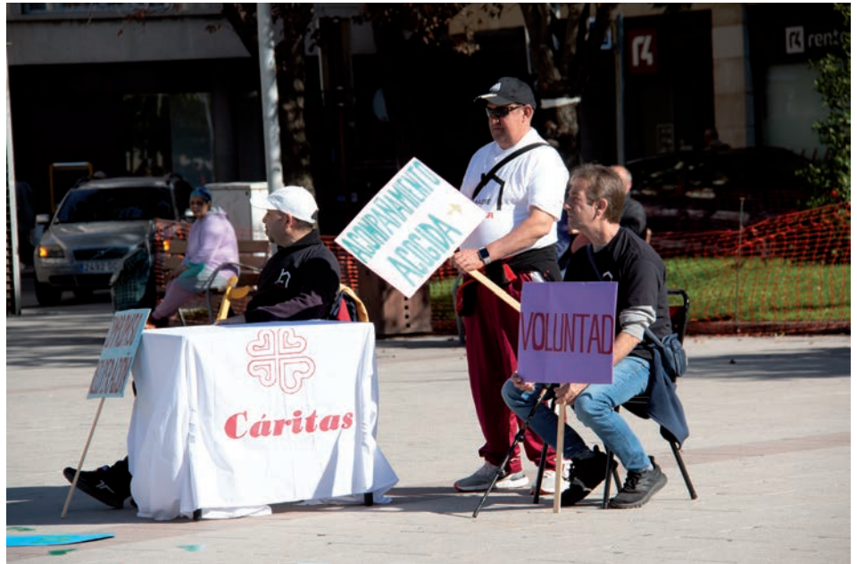
Los centros para personas sin hogar de Cáritas prepararon una dinámica participativa para los participantes en el acto

«Nuestro trabajo pretende acoger, acompañar y apoyar en el acceso a sus propios derechos como ciuda-