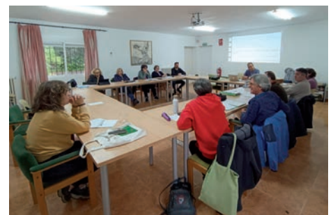
Un momento de la asamblea

«Esta asamblea diocesana ha significado un empuje en la vocación y misión de sus militantes, para crecer en comunión y compro-