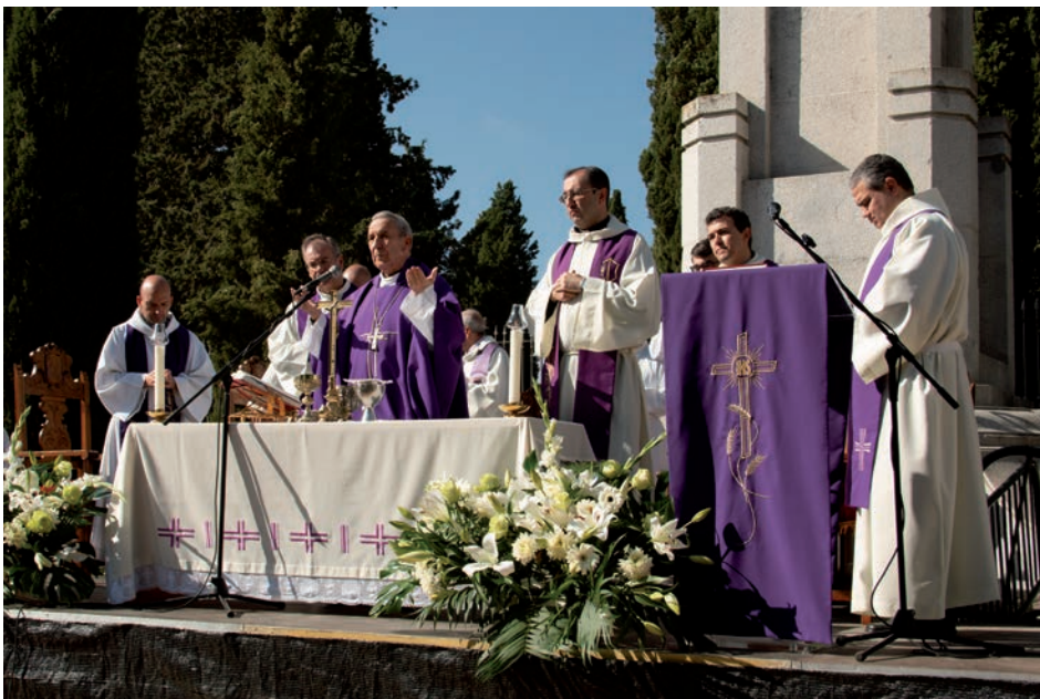
Sacerdotes de la capital concelebraron en la misa