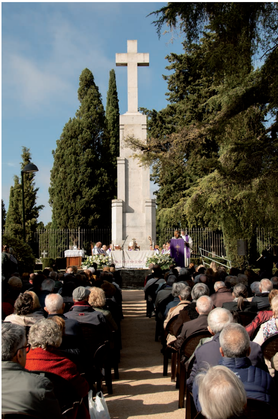
La celebración de la misa tuvo lugar a las puertas del cementerio de Ciudad Real

La oración por los difuntos se fundamenta en la fe y en la esperanza cristiana. En este sentido, el obispo citó a san Agustín: «La fe tiene ojos más grandes, más potentes y más perspicaces que el cuerpo. A los que murieron se les llama durmientes porque en su día serán resucitados. Y, si buscáis la verdad, veréis que nuestros padres viven porque el alma no muere».