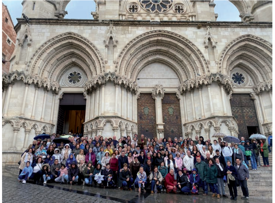
Algunos de los participantes al final del encuentro

El obispo de Cuenca recordó que «Cáritas es una palabra densa, una palabra que tiene que ser siempre una bomba» porque «Cáritas es la caridad de Dios que ha sido derramada en nuestros corazones, y nunca se puede perder de vista que el amor cristiano es como una bomba que se derrama». Señaló, además, que «los voluntarios de Cáritas hacen y construyen camino».