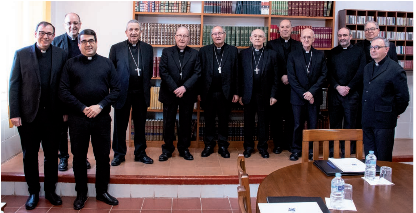
Los obispos de las cinco diócesis de Castilla - La Mancha junto a los rectores de los seminarios en el Seminario de Ciudad Real

El pasado 16 de febrero, los cinco obispos de las diócesis de la provincia eclesiástica de Toledo celebraron una reunión en el Seminario de Ciudad Real