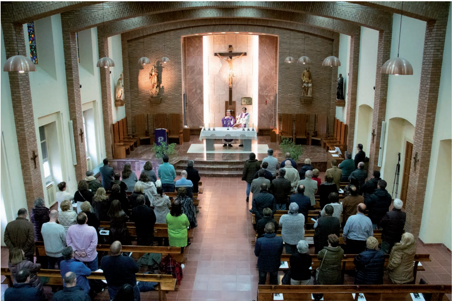
Un momento de la misa en la capilla mayor del Seminario