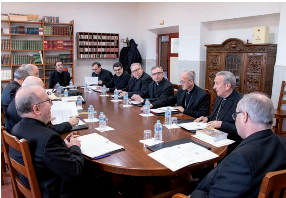
Un momento de la reunión de los obispos junto a los rectores de los seminarios de la provincia eclesiástica de Toledo

Según la temática de cada encuentro, en algunas de las reuniones, los obispos reciben a las personas relacionadas con los distintos ámbitos pastorales que se tratan. En esta ocasión, contaron con la presencia de los rectores de los seminarios diocesanos de Castilla-La Mancha. Dialogaron sobre los temas tratados en el encuentro de los obispos españoles con el Papa y los responsables del Dicasterio para el Clero del 28 de noviembre de 2023. En aquella reunión, que sirvió para dar cuenta del resultado de la visita apostólica a los seminarios españoles del primer trimestre de 2023, se entregó a los obispos un documento de trabajo del Dicasterio para el Clero.