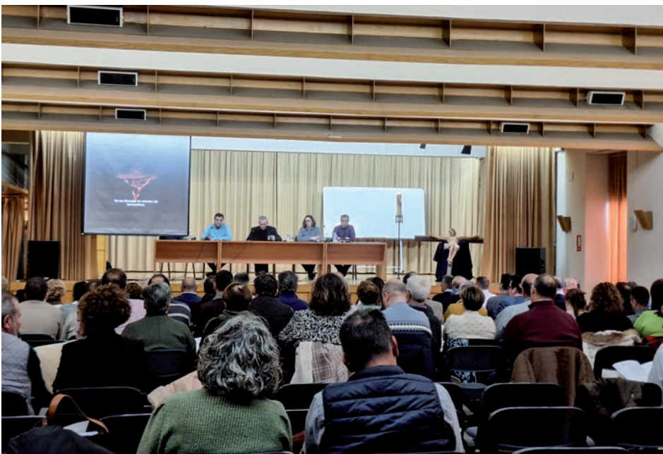
El salón de actos del Seminario durante la jornada

En esta línea, ante todos los sufrimientos que podemos presentir y vivir, el obispo animó a los miembros de hermandades a vivir el estilo de vida de Jesús, «aunque cueste», puesto que «nos espera una vida feliz» en la que el Señor