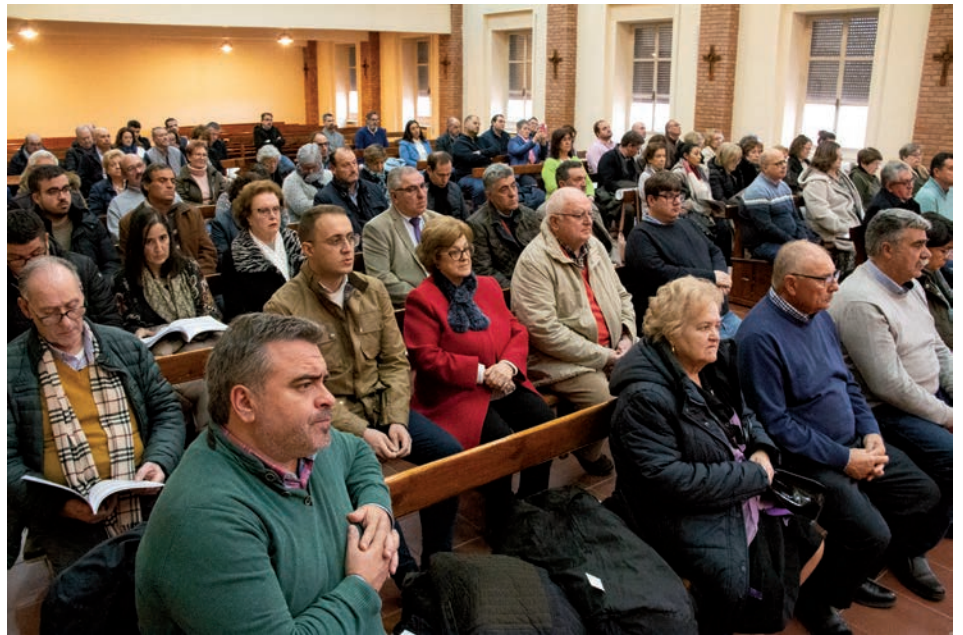
Los miembros de hermandades durante la eucaristía

«Tenemos que escuchar a Jesús, tenemos que leer el Evangelio, tenemos que ver qué es lo que nos pide a cada uno de nosotros»