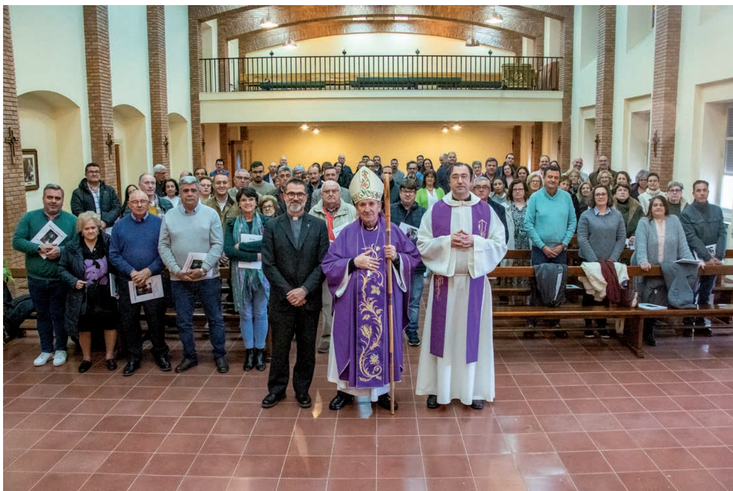
Foto de grupo al final de la convivencia en la capilla mayor del Seminario Diocesano

El pasado domingo, 25 de febrero, el obispo dirigió una convivencia en el Seminario Diocesano con miembros de hermandades de Semana Santa de toda la diócesis.