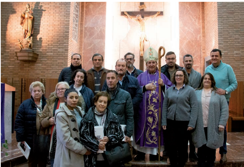
Uno de los grupos que participó en la convivencia

Estos encuentros con hermandades de toda la diócesis, comenzaron a celebrarse en el año 2017. Desde entonces, han reunido a cientos de cofrades en jornadas para la revisión de la vida de fe, siguiendo una petición del obispo a las hermandades durante todos estos años: que vivan la fe en la calle, pero también en la Iglesia; en las procesiones, pero también en la liturgia de los templos, y no solo en los días en los que celebran los actos de sus titulares, sino durante todo el año.