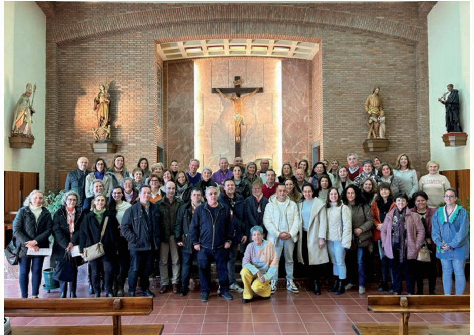
Los profesores de religión que participaron en el retiro, junto al obispo, en la capilla mayor del Seminario

En la provincia, hay 229 profesores en la enseñanza pública, realizando su trabajo con vocación, rigor y profesionalidad e implicándose en sus centros en otras actividades educativas.