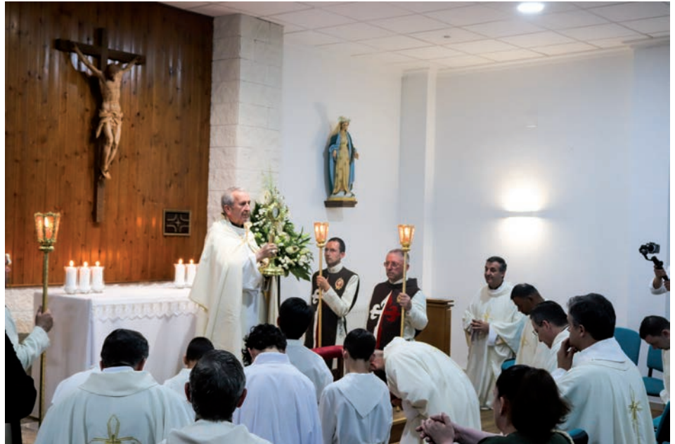
Bendición con el Santísimo en la inauguración de la capilla de adoración perpetua el pasado 7 de junio.

Ante la presencia de Cristo en la eucaristía y la oración, Cristo «va a