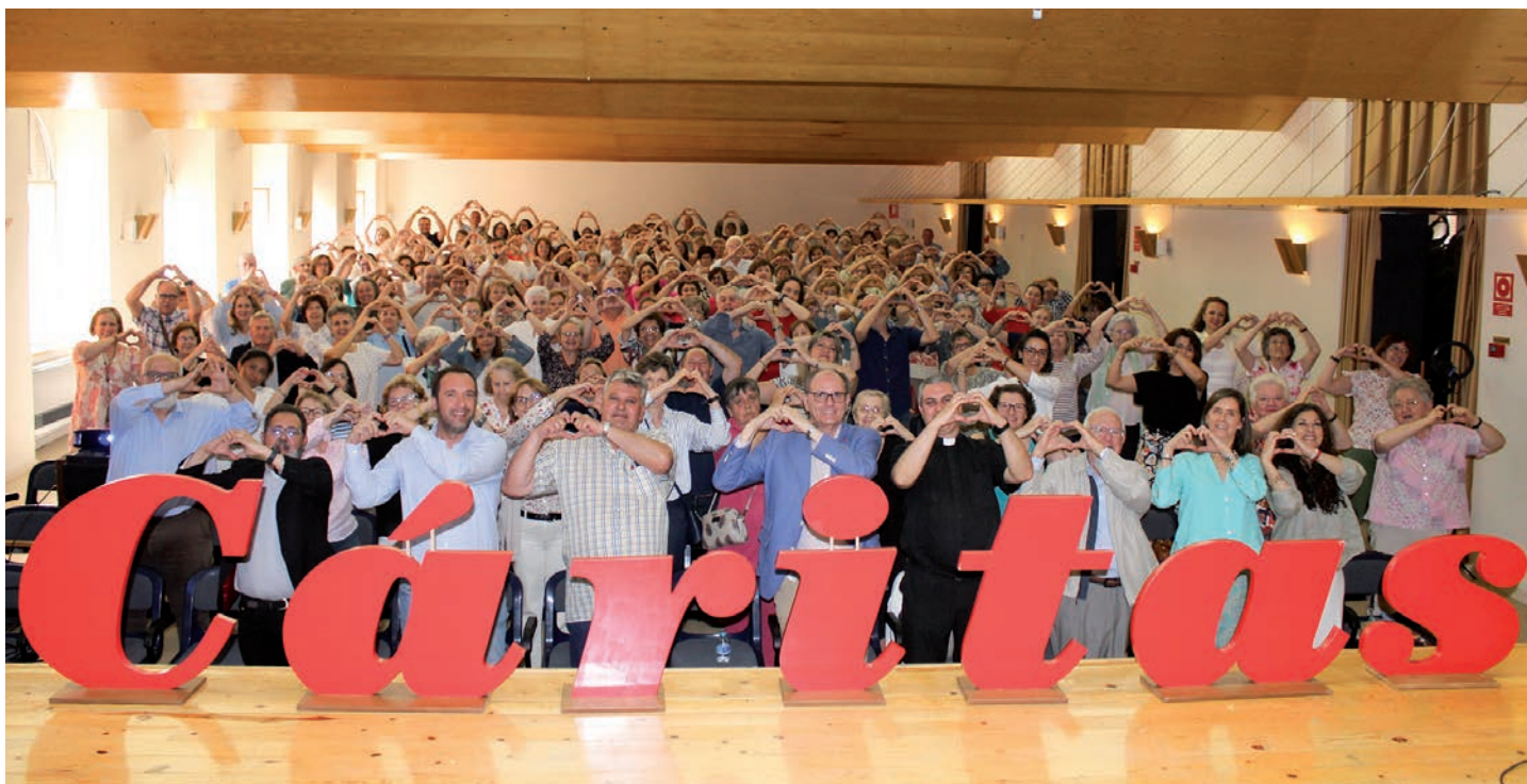
Foto de grupo al final del encuentro