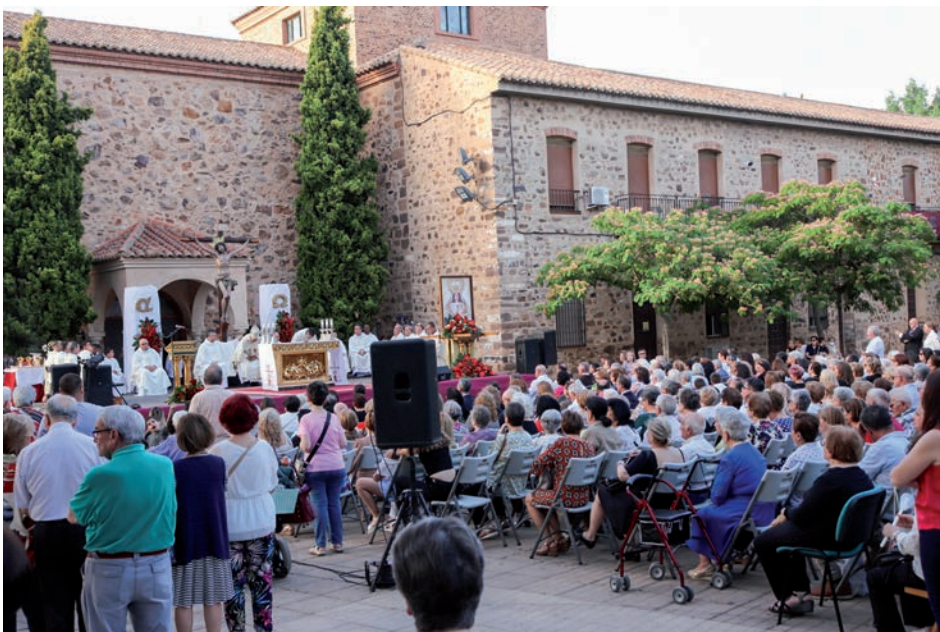
La misa se celebró en la explanada de la Virgen de Gracia

Además, la oración exige y regala un compromiso, «no se trata de ponernos muy románticos