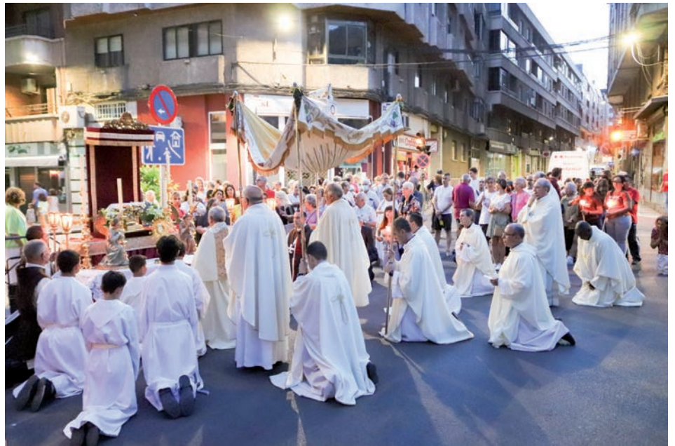
Más de quinientas personas participaron en la misa y en la procesión posterior a la capilla

«Que aprovechemos, queridos hermanos, esta oportunidad que el Señor nos da de hacernos comprender el amor tan grande que Él nos tiene, que se ha querido quedar con nosotros para siempre y ha querido quedarse para escucharnos y escuchar nuestras dolencias y nuestras alegrías, pero también nos pide que seamos auténticos, que aquello que vivimos junto a Él, seamos capaces después de vivirlo en nuestra vida», reconociendo «las necesidades de otros muchos [...] que van a estar también presentes en nuestra oración para que el Señor les ayude», concluyó.