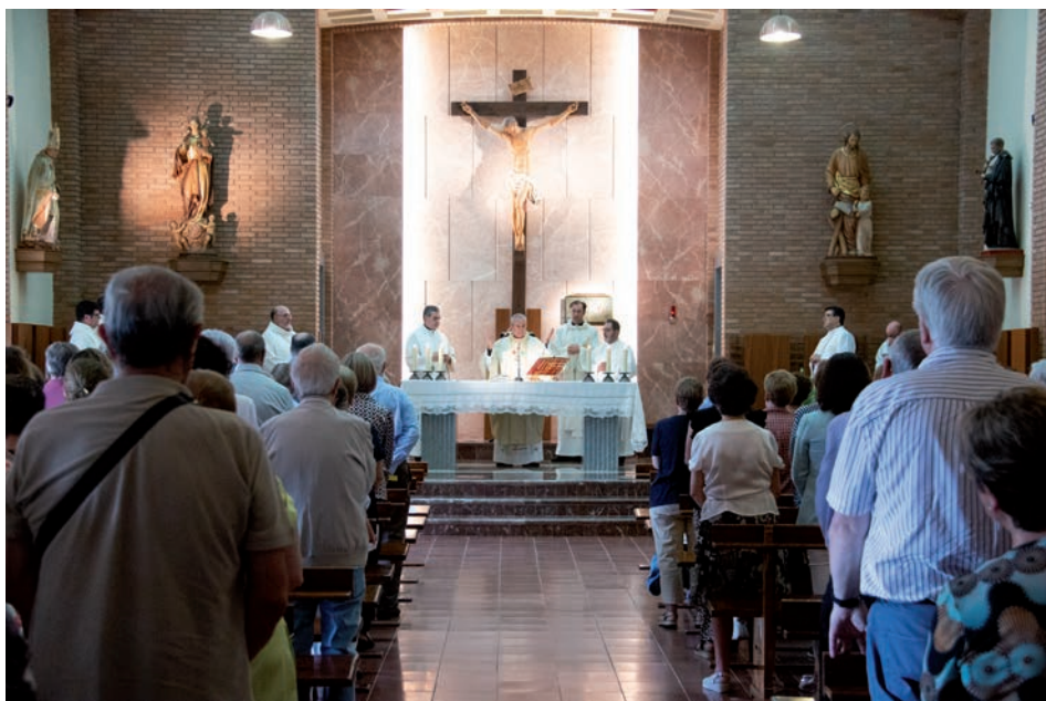
En la misa concelebraron varios sacerdotes de la diócesis

Martín señaló que «Cáritas es cercanía, compasión y ternura. Somos Iglesia al servicio de los pobres y Cáritas tiene que ser el cauce de la caridad en la comunidad. Ya que no hay Cáritas sino es desde la comunidad cristiana, y no hay comunidad cristiana sino vive y cuida la dimensión caritativa y social de la Iglesia».