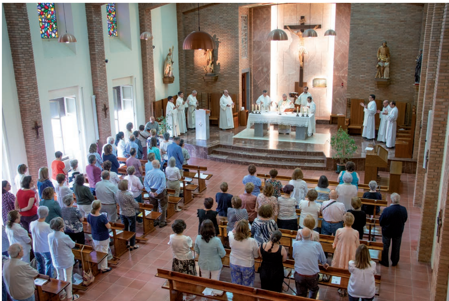
Más de 200 personas participaron en la celebración