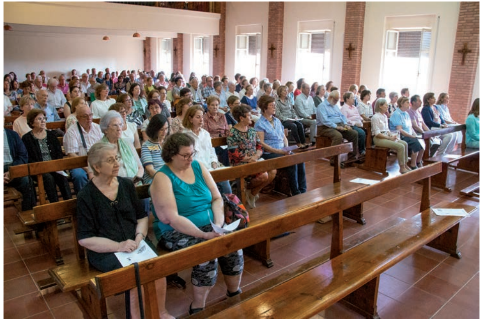
Voluntarios y trabajadores de Cáritas durante la misa

Un segundo sentimiento que surge es el de «la necesidad que sentimos de la ayuda de Dios», puesto que «tenemos que reconocer que no podemos llegar a todos los pobres ni a todas sus necesidades». Sin Dios, dijo, «seríamos una ONG más que atiende necesidades sociales. Pero no somos una ONG. Somos la caridad de la