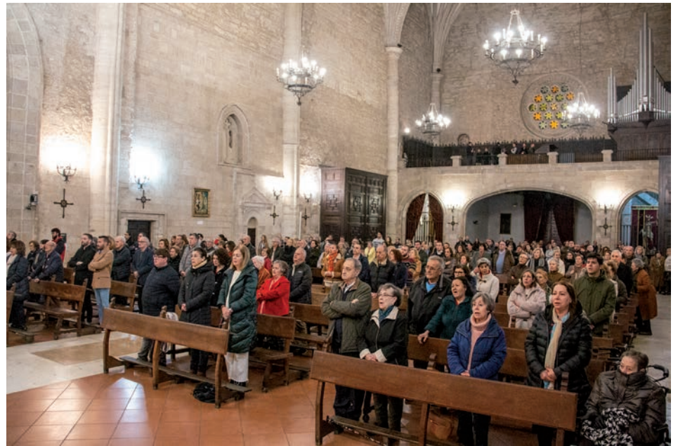
La catedral durante la celebración del Miércoles de Ceniza

A través del código puedes ver un resumen de la celebración en vídeo