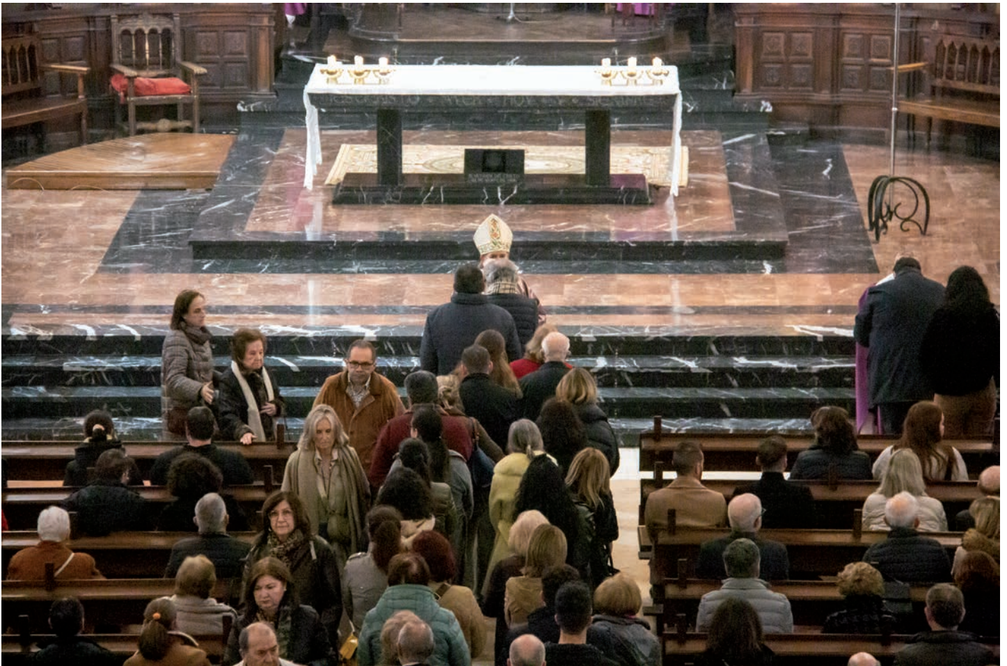
Un momento de la imposición de la ceniza