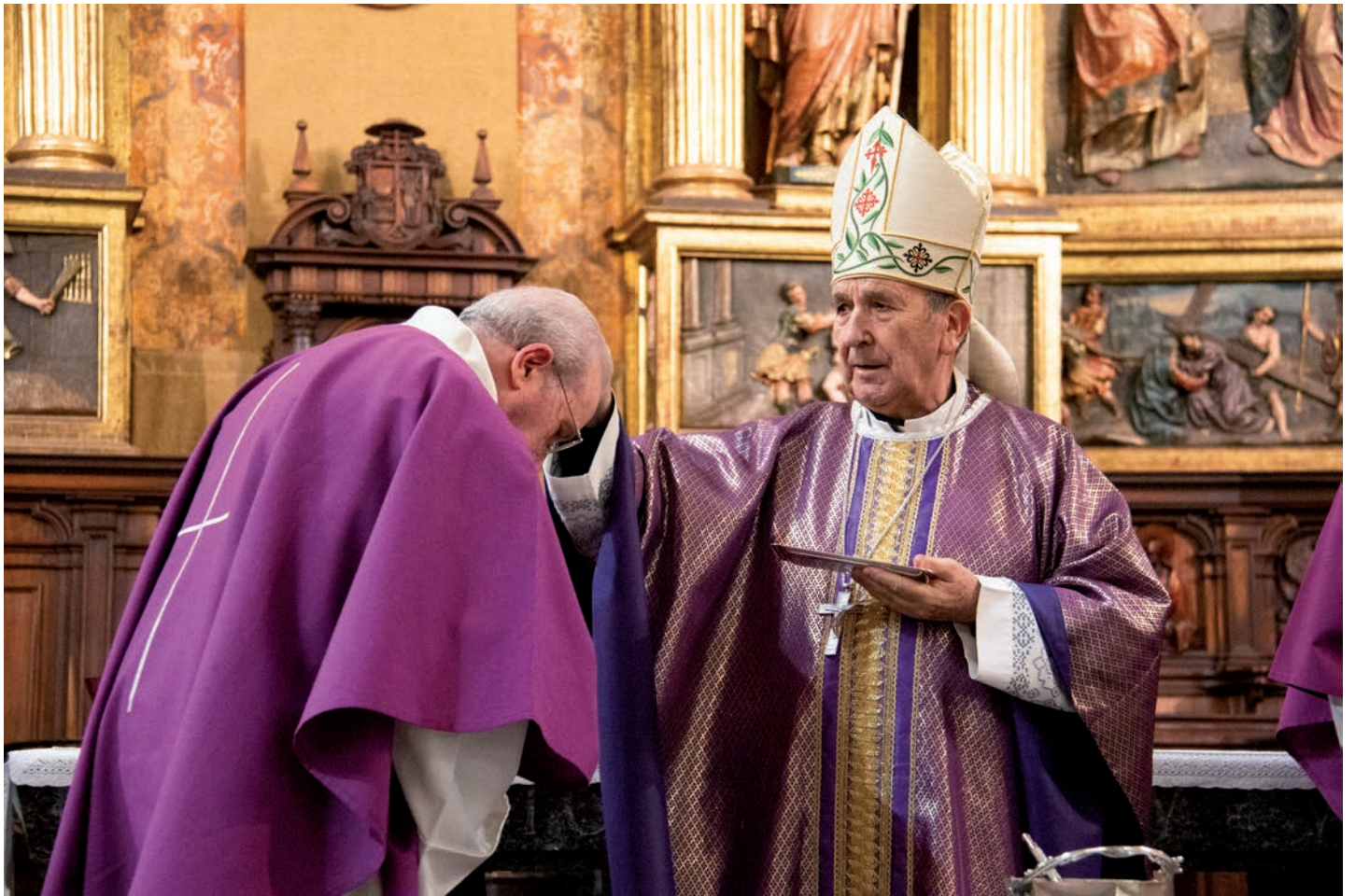
Imposición de la ceniza el pasado 14 de febrero en la catedral

El pasado 14 de febrero, comenzamos la Cuaresma. En las parroquias, se impuso la ceniza a los fieles como signo del inicio de un camino de conversión.