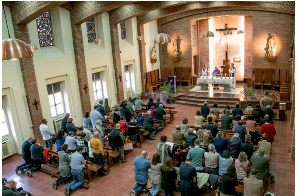
Un momento de la misa en una de las convivencias del curso pasado

La jornada comienza a las 10:15 h. con la acogida y el reparto de materiales y la acomodación de los niños con sus cuidadores, a las 10:30 comenzamos la oración personal y comunitaria y la revisión de la vida cris-