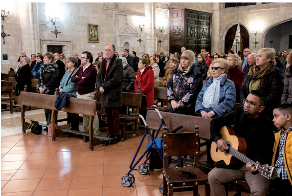
Voluntarios de Manos Unidas durante la misa

El obispo concluyó sus palabras con una petición al Señor: «Si tú quieres, puedes meter en el corazón de los hombres que pueden cambiar el mundo». Este es el sentido esperanzador del lema de la campaña de Manos Unidas — El efecto ser humano —, que los hombres podemos cambiar el mundo.