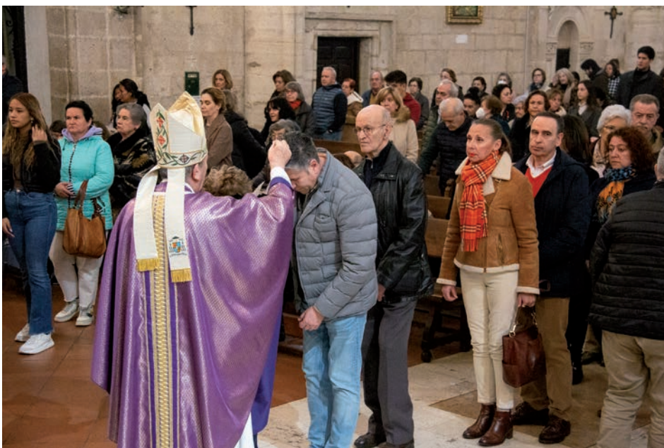
Al imponer la ceniza, el sacerdote hace la señal de la cruz en la cabeza mientras pronuncia: «Conviértete y cree en el evangelio»

«Tratemos de convertirnos de todos los apegos de nuestro corazón quitando todo eso que sabemos que Dios no quiere de nosotros[...]. Comencemos este tiempo, este camino de Dios y que Dios nos propone de abrirnos a la justicia, que no es sino abrirnos y vivir desde la fe en Jesucristo. [...] Si recibimos con este espíritu la ceniza en el día de hoy, estaremos en el verdadero camino que nos lleva a Dios, el auténtico camino de conversión y la auténtica hoja de ruta hacia la Pascua y a la resurrección de Cristo y con Cristo. A una vida realmente nueva, de acuerdo con su voluntad», concluyó.