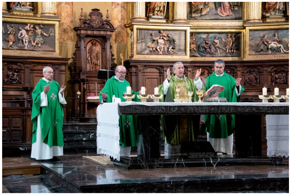
Celebración de la eucaristía en la catedral el pasado 11 de febrero

Para buscar solución a este problema, se refirió al «modo concreto» de cuidar la vida de los demás que nos enseña Cristo: «Dar de comer al hambriento, dar de beber al sediento, visitar al enfermo, crear trabajo, tender la mano a quien nos encontramos