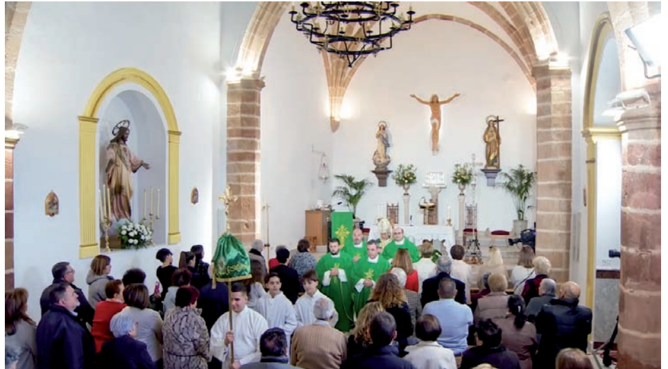
Un momento de la misa en Alcubillas

«Que el Señor, que acogió y cogió de la mano a la suegra de