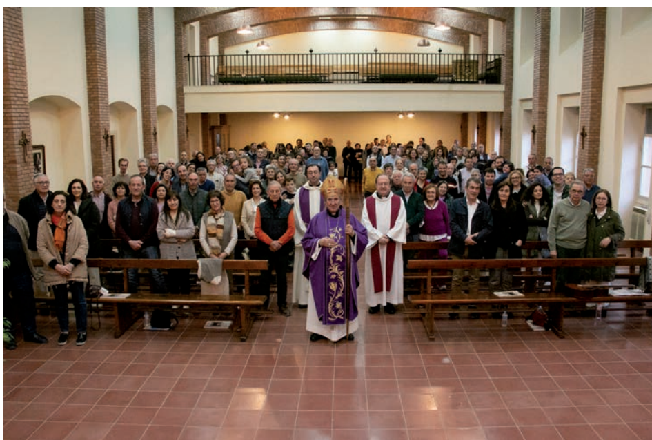
Convivencia de matrimonios del pasado 14 de marzo de 2023

Tal y como indica el tríptico que ya se puede encontrar en las parroquias y que contiene la hoja de inscripción, el encuentro busca el encuentro con Dios y con uno mismo, revisar la vida de fe, renovar la vida como matrimonio y renovar