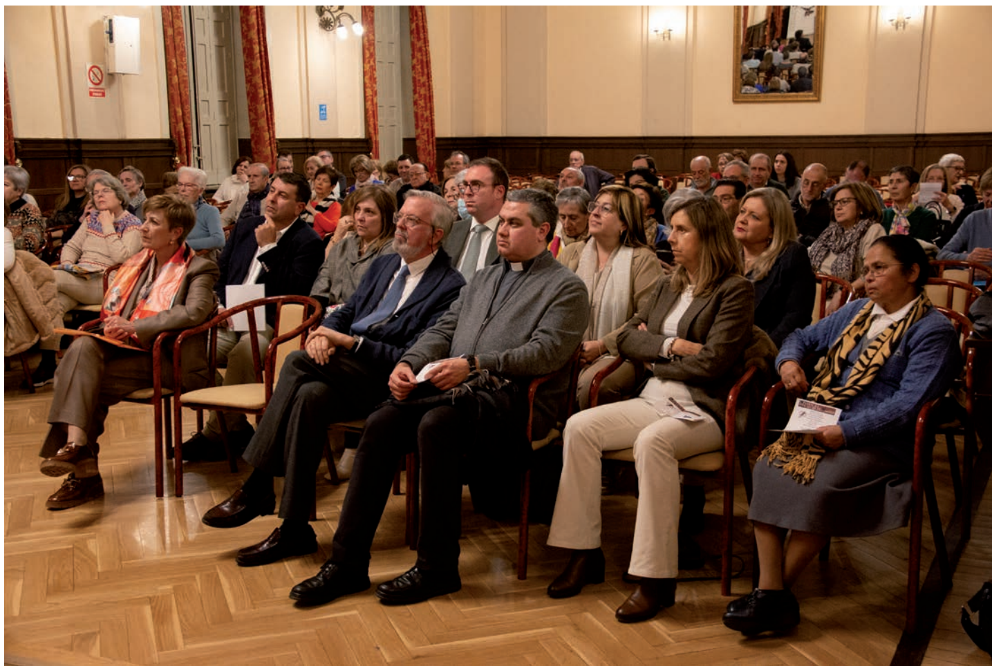
Presentación de la campaña en el Antiguo Casino de Ciudad Real el pasado 6 de febrero

Manos Unidas, la asociación de la Iglesia católica en España para la ayuda, promoción y desarrollo de los países más desfavorecidos, lleva sesenta y cinco años trabajando para construir un mundo más justo. A partir de la celebración de la jornada nacional el pasado domingo 11 de febrero, a lo largo del mes, en toda la diócesis de Ciudad Real, se están llevando a cabo diferentes actividades para el lanzamiento de la campaña.