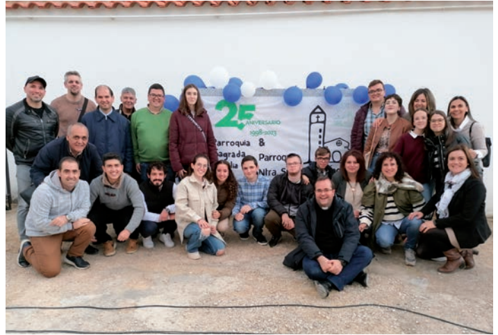
Seminaristas y jóvenes junto a los dos párrocos

Ntra. Sra. de los Ángeles y la Sagrada Familia, las dos parroquias más jóvenes de Tomelloso, celebraron, el domingo 29 de octubre, una jornada de convivencia, formación y oración por los 25 años como comunidades parroquiales.