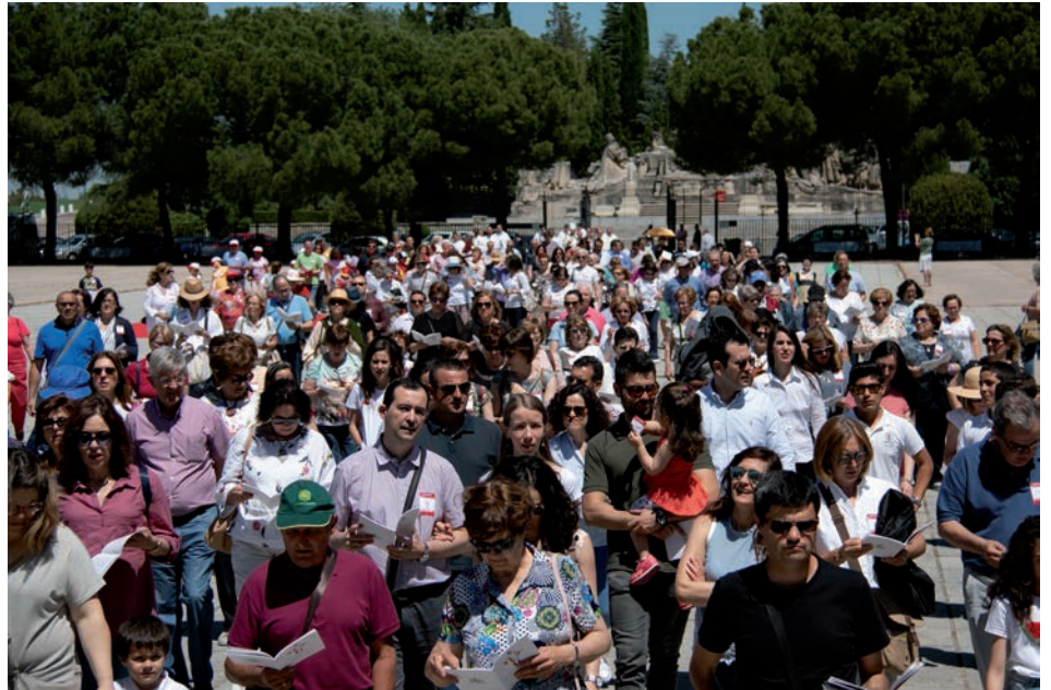
Peregrinación diocesana al Cerro de los Ángeles en 2019

La familia se encuentra entre esas realidades que, sencillamente, te tocan, sin que se haya tenido oportunidad de elegir. Muchos cuentan con el fabuloso regalo de una buena familia, más aún, con el de una excepcional. Esta especie de suerte sobrevenida acompaña durante toda la vida en los afectos propios, principios, valores, modos de mirar el mundo y de interpretarse uno a sí mismo. Sin embargo, lejos de discriminar dentro de la familia entre quienes ofrecen y recogen, todos sus miembros están capacitados tanto para recibir como para dar. Es más, la familia será más sana en la medida en que cada cual aporte lo que puede y reciba lo que los otros han entregado. De forma más llana: la familia es construida entre todos los de la