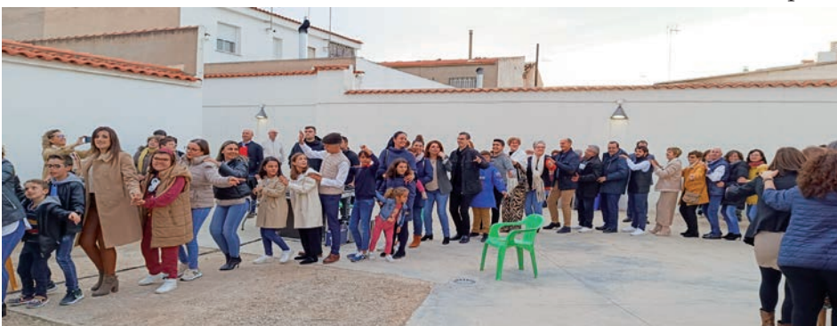
Un momento de la celebración

El templo de Ntra. Sra. de los Ángeles se dedicó el 6 de junio de 1971, pero la parroquia construyó después el templo actual, que se dedicó en el año 2015. Por otro lado, el templo de la Sagrada Familia se bendijo el 7 de marzo de 1976.