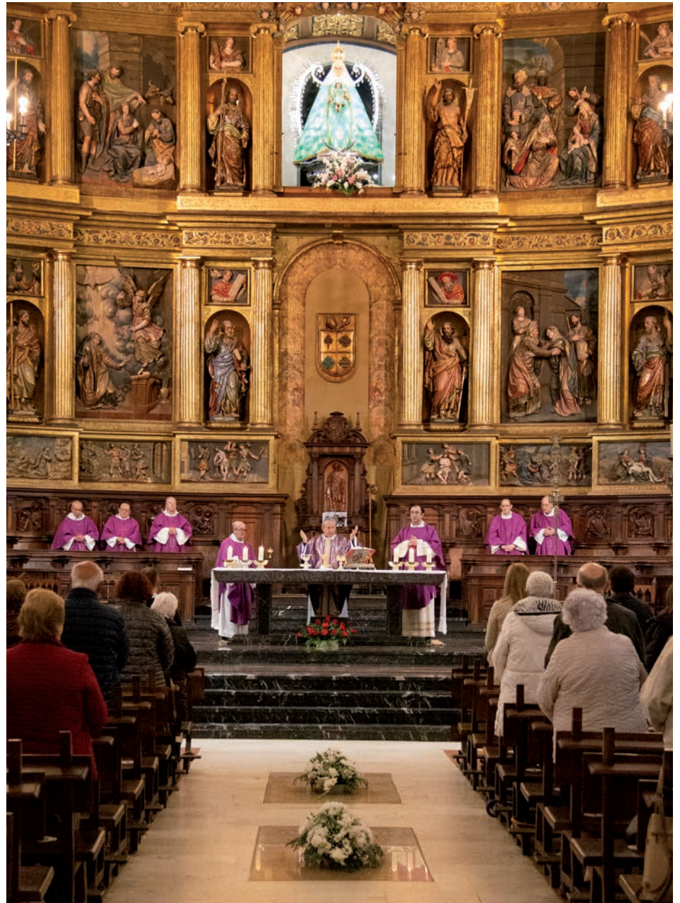
Las lápidas de los obispos de la diócesis enterrados en nuestra catedral tenían ofrendas florales. Un ramo de rosas rojas se dispuso bajo el altar, donde se encuentran los restos de los beatos mártires Narciso Estenaga, obispo, y Julio Melgar, sacerdote

Por eso, la misa de ayer «tiene perfecto sentido para ellos y para