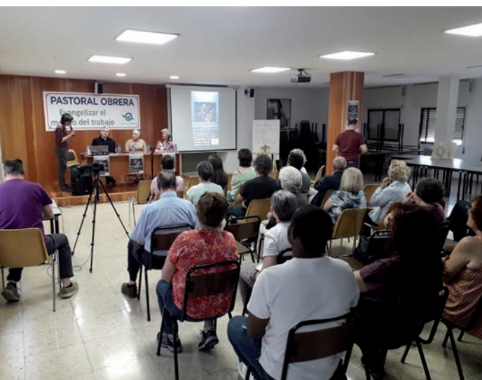
Un momento del encuentro de Pastoral Obrera

Concluyó preguntándose si la Iglesia puede ser misionera sin estar encarna-