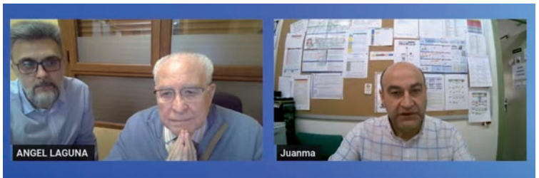
Un momento de la entrevista

Laguna narró la historia del Camino Neocatecumenal desde sus comienzos y de sus fundadores, Kiko Argüello y Carmen Hernández, que comenzaron el nuevo movimiento entre los pobres. Explicó la misión del Camino: redescubrir el bautismo en las parroquias, con una intención concreta de ir a los más alejados.