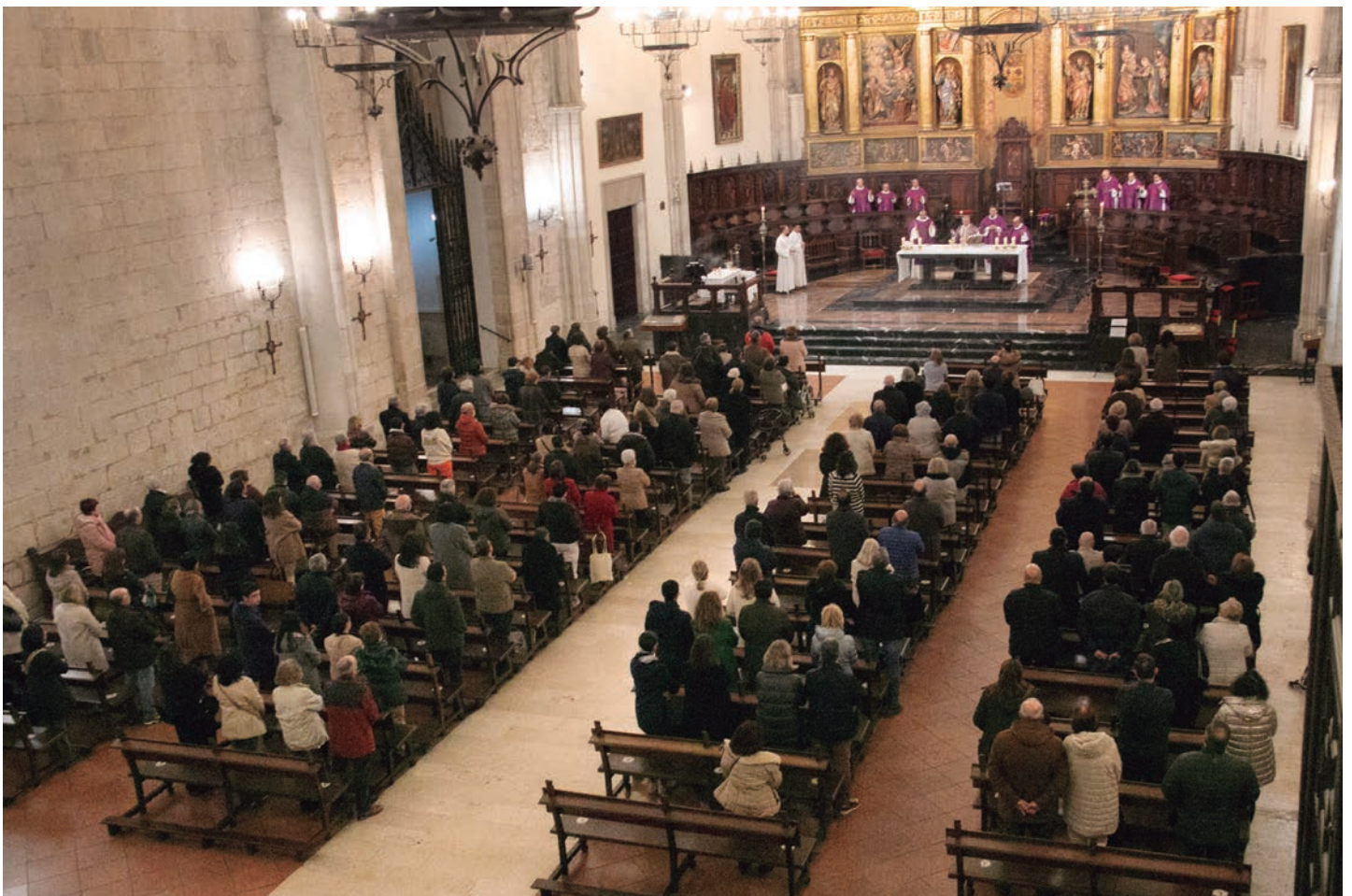
La catedral el pasado Miércoles de Ceniza