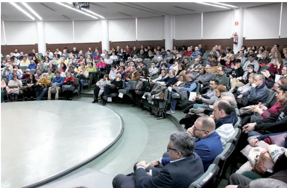
Aspecto del aula magna durante la conferencia

La Pastoral Universitaria se reúne en el Centro Juvenil San Juan Pablo II la tarde de cada lunes, después de la oración en la capilla de María Inmaculada. Allí se tratan distintos temas sociales o religiosos, abiertos a debate y con la ayuda de invitados.