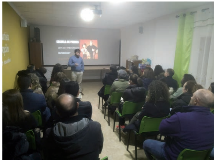
Un momento de la reunión de la escuela de padres en la parroquia de La Solana

Las familias reflexionaron sobre las principales características de la adolescencia y los cambios que sufren los jóvenes durante los años que dura esta etapa evolutiva. «A partir de ahí, se analizaron los comportamientos que se relacionan con esos cambios y las respuestas que pueden dar los padres» para situarse y responder de forma solvente y tranquila, explican desde la parroquia organizadora de la escuela.