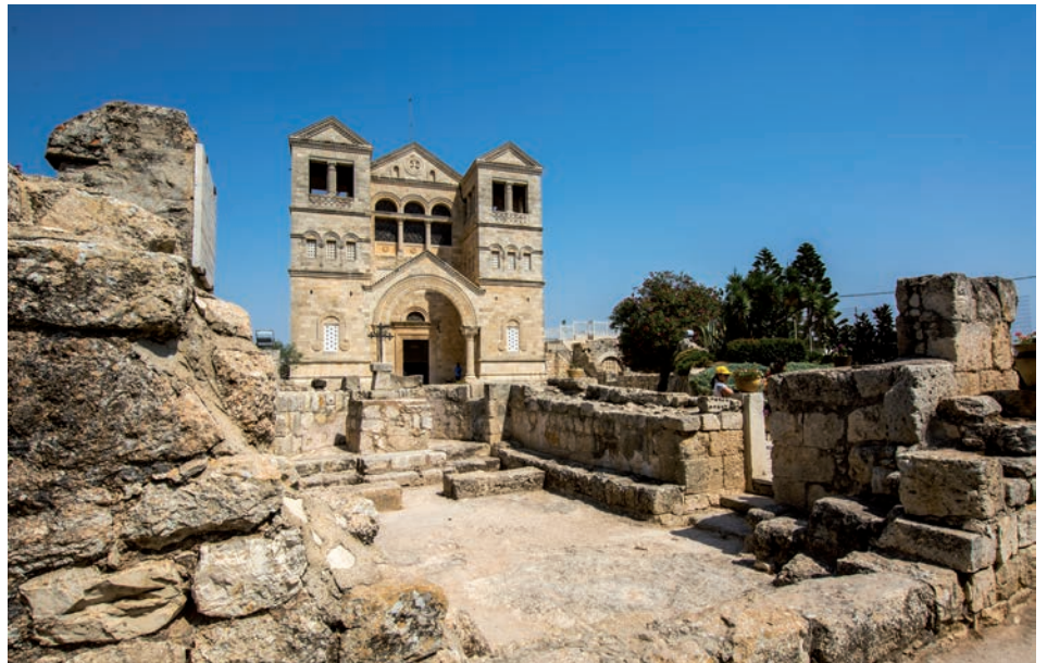
La Basílica de la Transfiguración es una iglesia franciscana ubicada en el Monte Tabor en Israel

Es curioso que el acento de la Cuaresma en este ciclo A (lecturas típicas de la iniciación cristiana) sea bautismal. A veces, muchas veces, se nos olvida que la Cuaresma no es un periodo de decadencia vital del cristianismo que se «mortifica a sí mismo». Se trata de avanzar de cerca con Cristo, camino del misterio Pascual: qué importante profundizar el camino cristiano como vocación bautismal, como