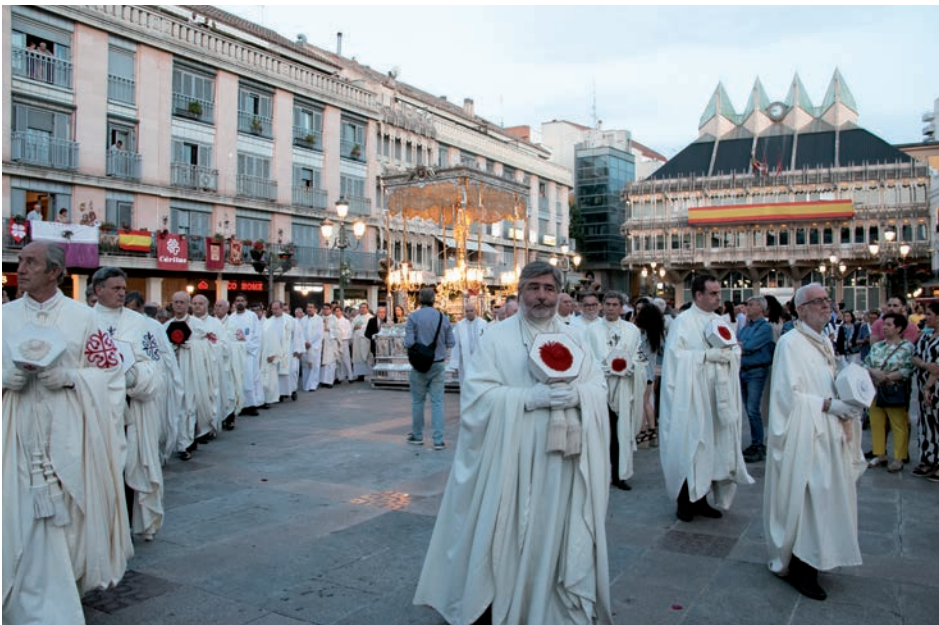
El Santísimo a su paso por la Plaza Mayor

Durante todo el recorrido, hermandades, asociaciones culturales y ONG como Manos Unidas, dispusieron alfombras de sal para el paso de la eucaristía. Dos horas después, el obispo impartió la bendición con el Santísimo, concluyendo una de las celebraciones del Corpus con más participación.