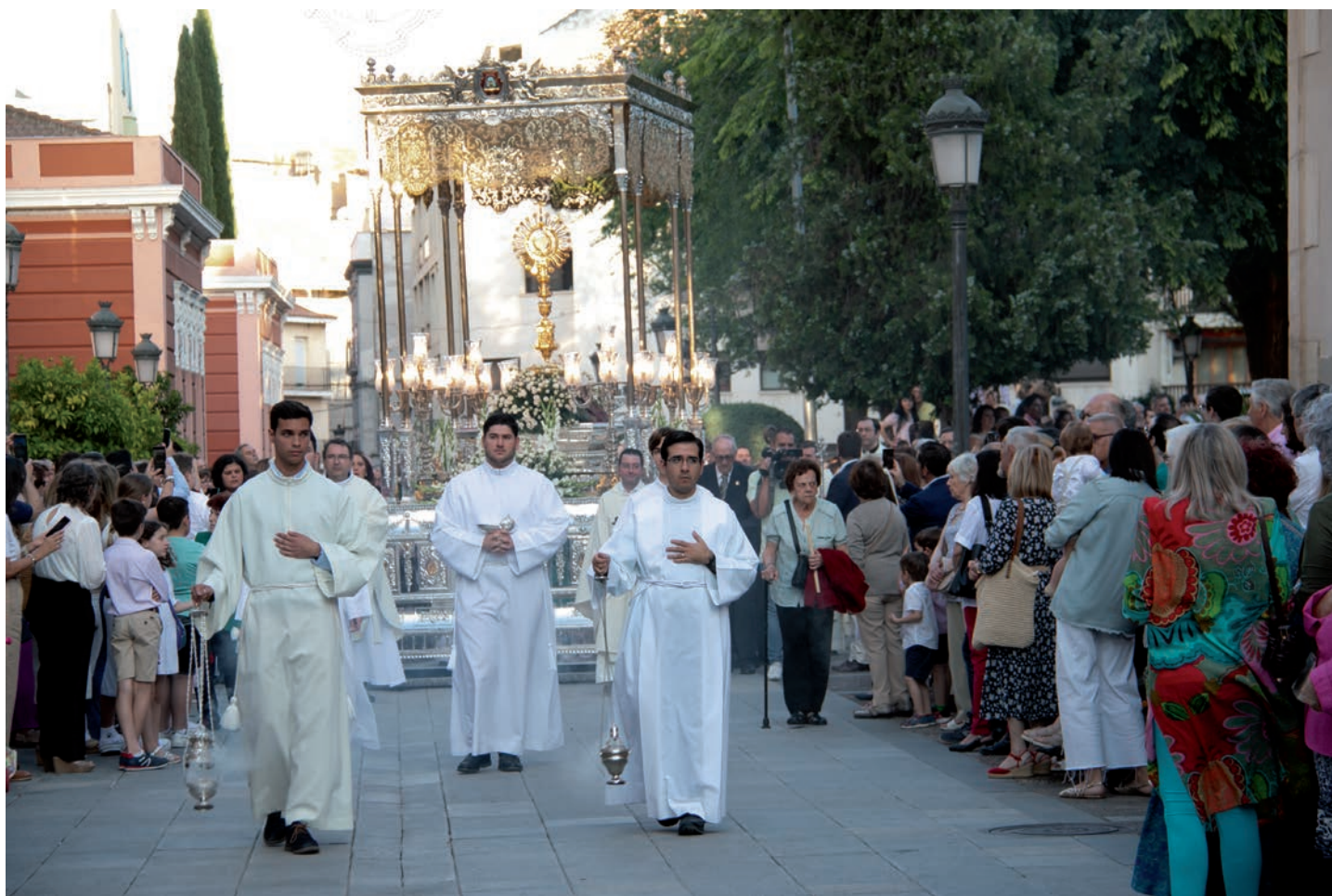
El Santísimo a la salida de la catedral, llegando al camarín de la Virgen

El 11 de junio celebramos la solemnidad del Corpus Christi en toda la diócesis. En la capital, el obispo presidió la misa en la catedral y la procesión que tuvo lugar después por las calles de Ciudad Real.