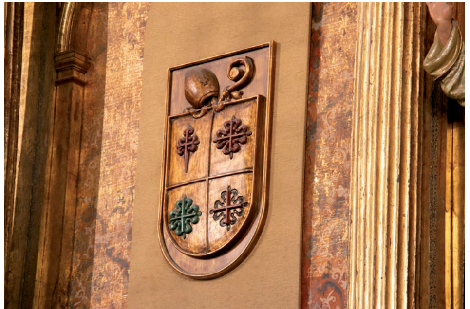
Escudo episcopal con las cuatro Órdenes Militares situado encima de la cátedra del obispo en la catedral

En el año 1158, el rey Sancho III ofrece la fortaleza de Calatrava (actualmente en Carrión de Calatrava) a quien la quiera poblar y