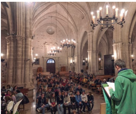
El grupo scout participó activamente en la oración en San Pedro