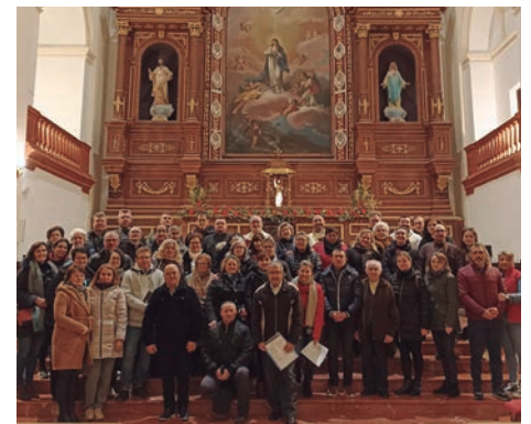
El grupo que rezó en la parroquia de Herencia

El pasado 20 de enero tuvo lugar, en el templo de San Pedro de Ciudad Real, la oración ecuménica de la diócesis. Fue al estilo de Taizé, rezando por la unidad de los cristianos en lo que fue la actividad central de la Semana de Oración por la Unidad de los Cristianos que se