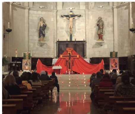
Un momento de la oración diocesana en San Pedro