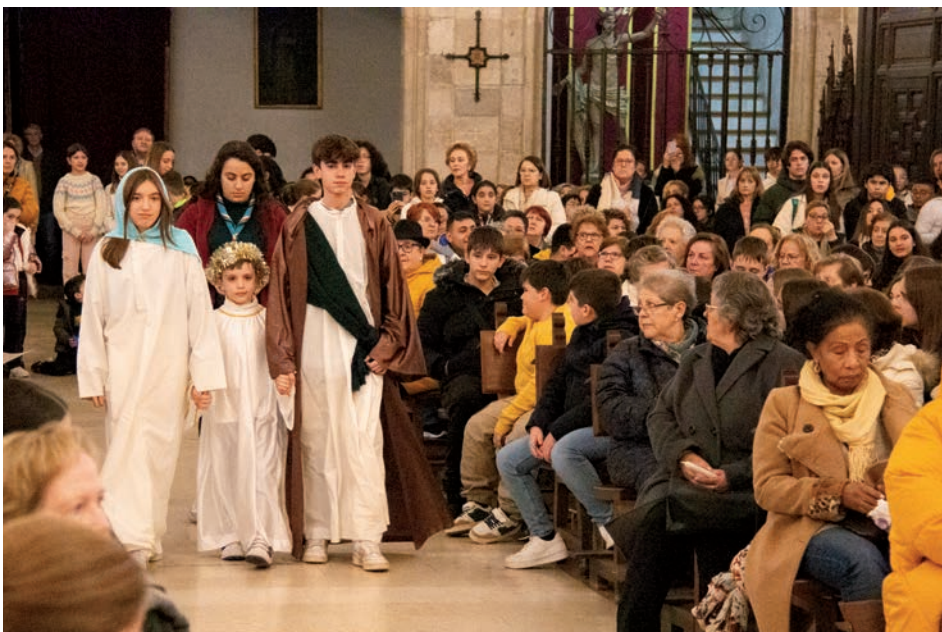
Los scouts llevaron la luz a la catedral

Después de esta celebración, la Luz de la Paz se ha repartido esta Navidad en hogares, residencias de ancianos, hospitales y en las prisiones de la provincia.