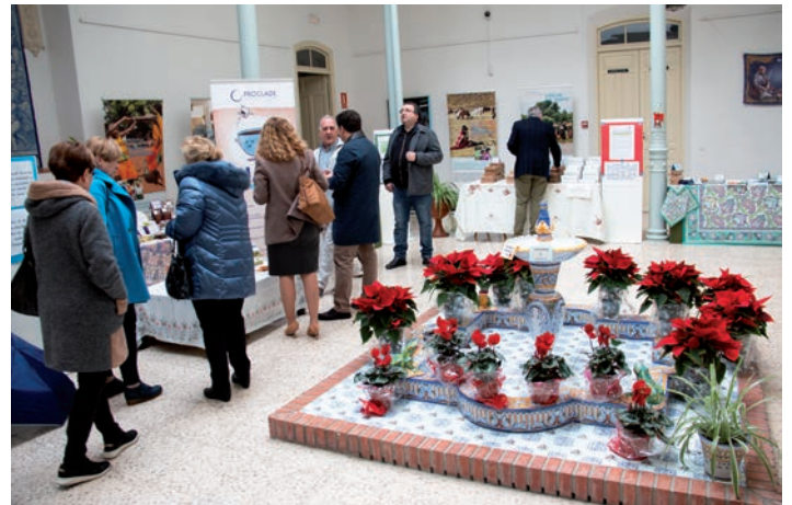
Un momento de la inauguración del mercadillo

En el mercadillo, que estuvo abierto hasta el 19 de diciembre, se podían adquirir productos originales de Manos Unidas, como los pañuelos que diseña en exclusiva para la ONG Lorenzo Caprile. Además, se