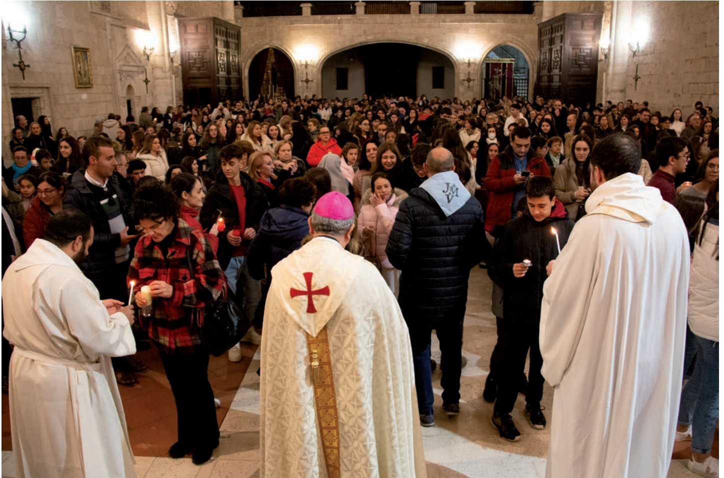
El templo se llenó para el reparto de la Luz de la Paz de Belén

El 15 de diciembre, la catedral acogió la llegada de la Luz de la Paz de Belén, una iniciativa de los scouts católicos que lleva por todo el mundo una llama encendida en el lugar de nacimiento de Jesús.