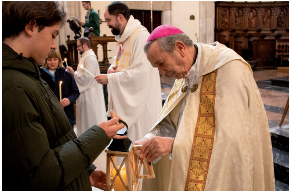
El obispo y varios sacerdotes se encargaron de repartir la luz

«Cuando recibimos la luz, recibimos un nuevo impulso para vivir la fe, una nueva llamada del Señor a ser creyentes y a vivir de acuerdo con la luz de Jesús»