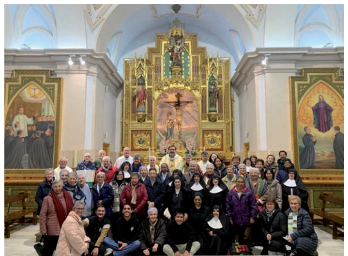
Algunos de los religiosos que participaron en el retiro

Por la tarde, tuvo lugar la asamblea de CONFER (Conferencia Española de Religiosos). Se renovaron cargos de CONFER y se presentó la memoria del año y el programa del próximo curso.