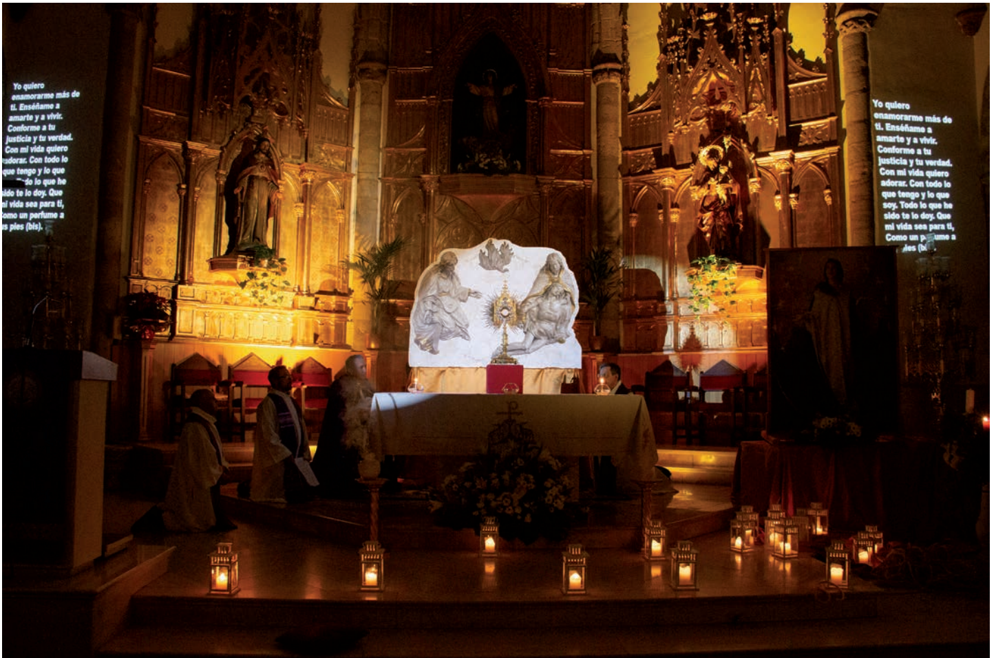
Un momento de la exposición del Santísimo