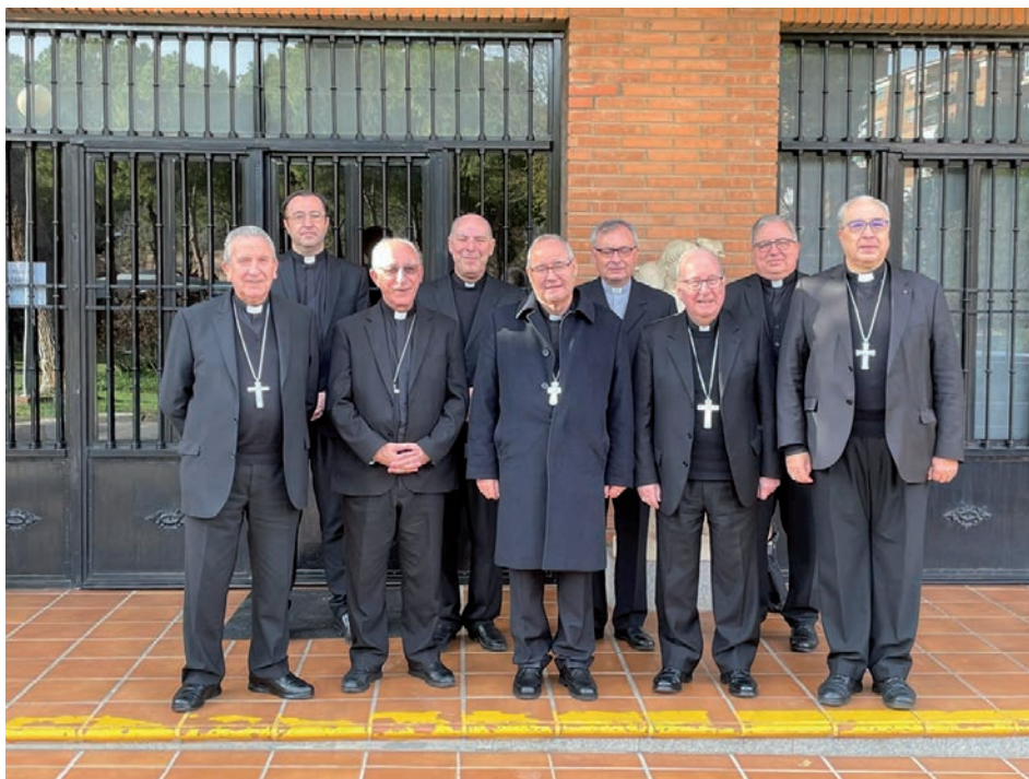
Obispos y vicarios de la provincia eclesiástica de Toledo

El mismo día, 5 de diciembre, cuando se celebraba el Día Internacional del Voluntariado, los obispos de la provincia eclesiástica hicieron pública una carta conjunta a los voluntarios de Cáritas en la que agradecen que haya «miles de hombres y