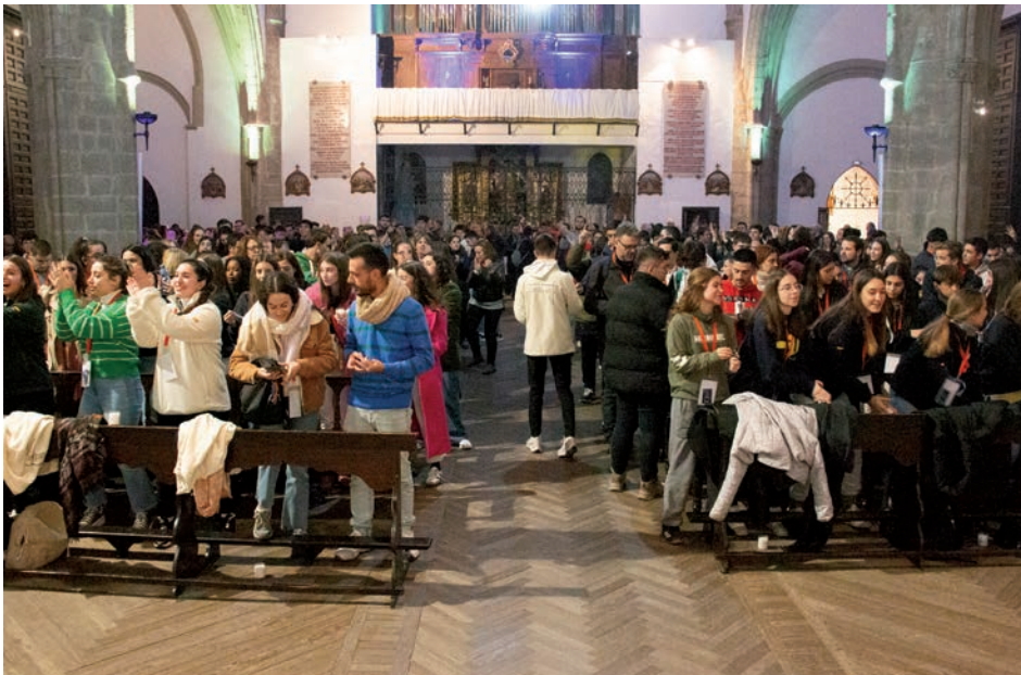
Final del encuentro en la parroquia de Santa María la Mayor de Daimiel

La marcha concluyó después con un chocolate antes de que los jóvenes emprendieran el camino a casa.