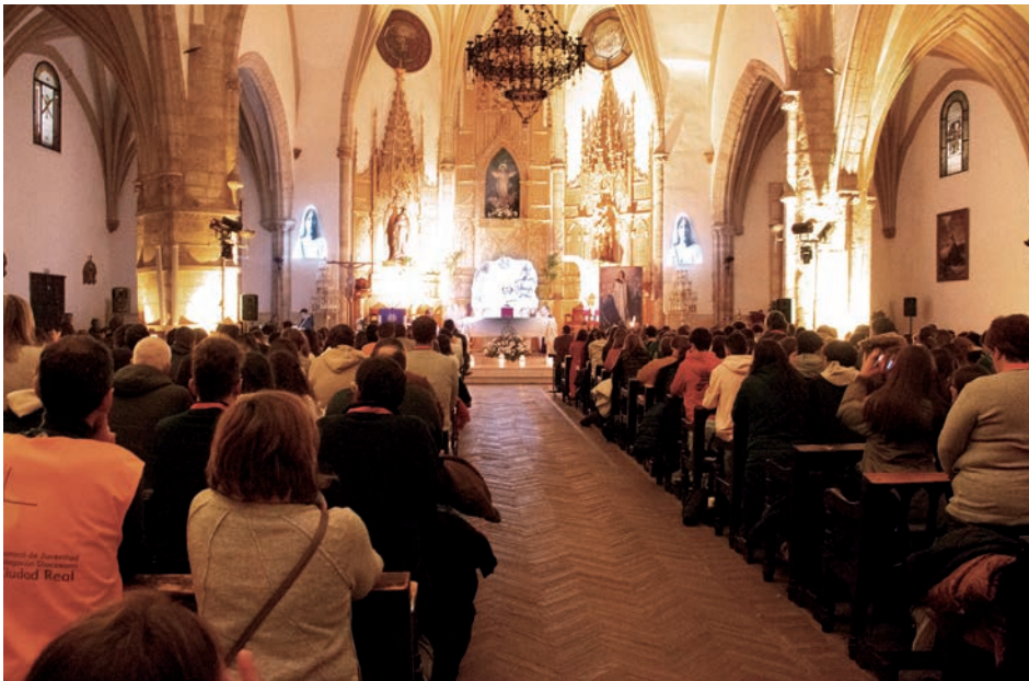
La parroquia de Santa María la Mayor se llenó para la vigilia

«La Iglesia, como madre, es capaz de acoger a las personas con sus heridas, sus vidas, sus historias, sus circunstancias»