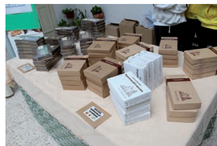
Productos en venta en el mercadillo del pasado año

Se podrán adquirir productos de comercio justo que aporta la Comunidad Salesiana de Puertollano, así como materiales educativos de Manos Unidas, dulces monacales y diversos productos