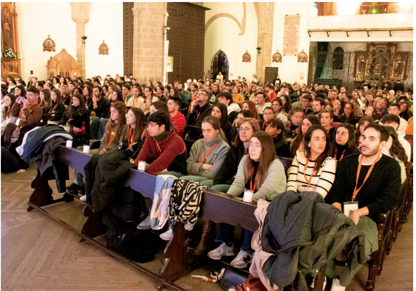
Momentos antes de comenzar la vigilia de oración en el templo de Santa María la Mayor de Daimiel

Más de trescientos jóvenes de toda la diócesis participaron en Daimiel, el pasado sábado 2 de diciembre, en la XXIV Marcha de Adviento, este año con el lema Todos, todos, todos.