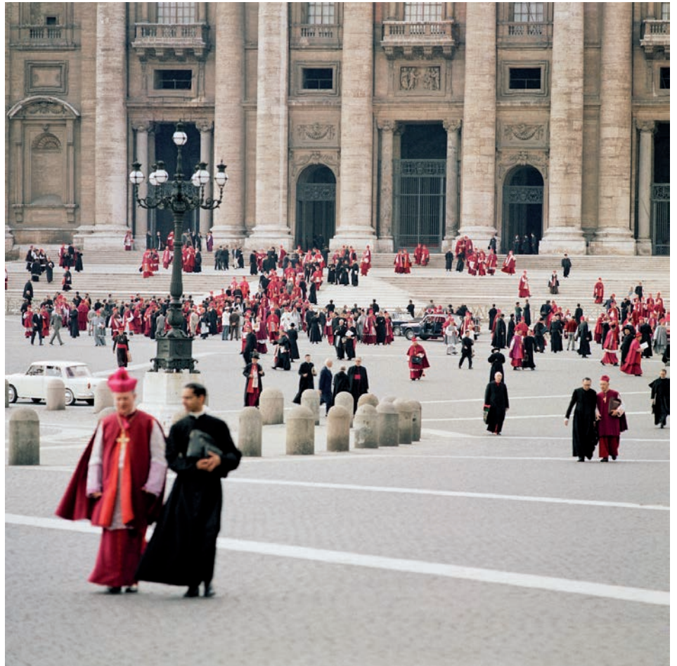
Salida de los padres conciliares de la basílica de San Pedro.

El Espíritu Santo no funciona con estrategias de partido según la moda, sino en la línea de la continuidad. El mismo Espíritu que aleteaba sobre la Iglesia del preconcilio hizo su trabajo durante los tres