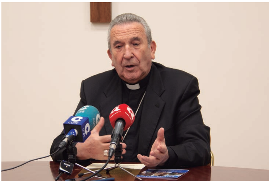
El obispo durante la rueda de prensa

Uno de los ámbitos de trabajo más importantes es el caritativo. En la diócesis hay centros de rehabilitación para drogodependientes que atendieron en 2021 a 718 personas. «Contamos con 1.000 voluntarios de Cáritas que ayudaron a 6.910 personas, y 260 voluntarios de Manos Unidas. Todas estas acciones