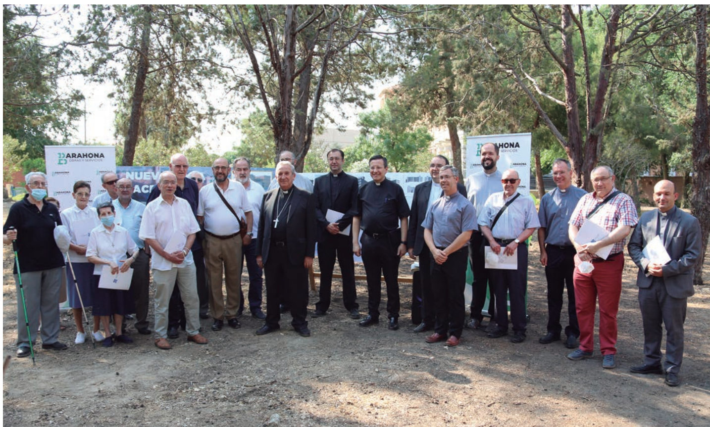
El obispo junto a sacerdotes y religiosos al finalizar el acto

El 14 de julio el obispo, don Gerardo Melgar, puso la primera piedra de la futura casa sacerdotal de Ciudad Real, que llevará el nombre de Santo Tomás de Villanueva, el patrón de la diócesis.