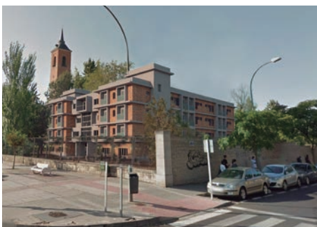
La casa sacerdotal se construirá en los terrenos del Seminario en la esquina de la carretera de Porzuna con la calle Amanecer

La edificación debería haber comenzado hace meses, pero «la subida de los precios en las materias primas, la inflación, han sido factores que nos han hecho frenar el proceso de la construcción», explicó. «El importe de la ejecución asciende a 5.797.873 euros, más