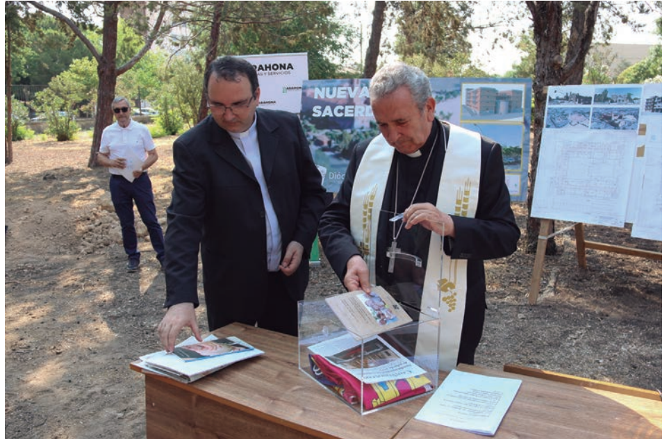
En la urna que se enterró en los terrenos que ocupará la casa se hace memoria de la fecha en la que se pone la primera piedra. Se guardaron banderas (española, de la región y europea), monedas, escritos del obispo, periódicos del día y el Con Vosotros del 17 de julio