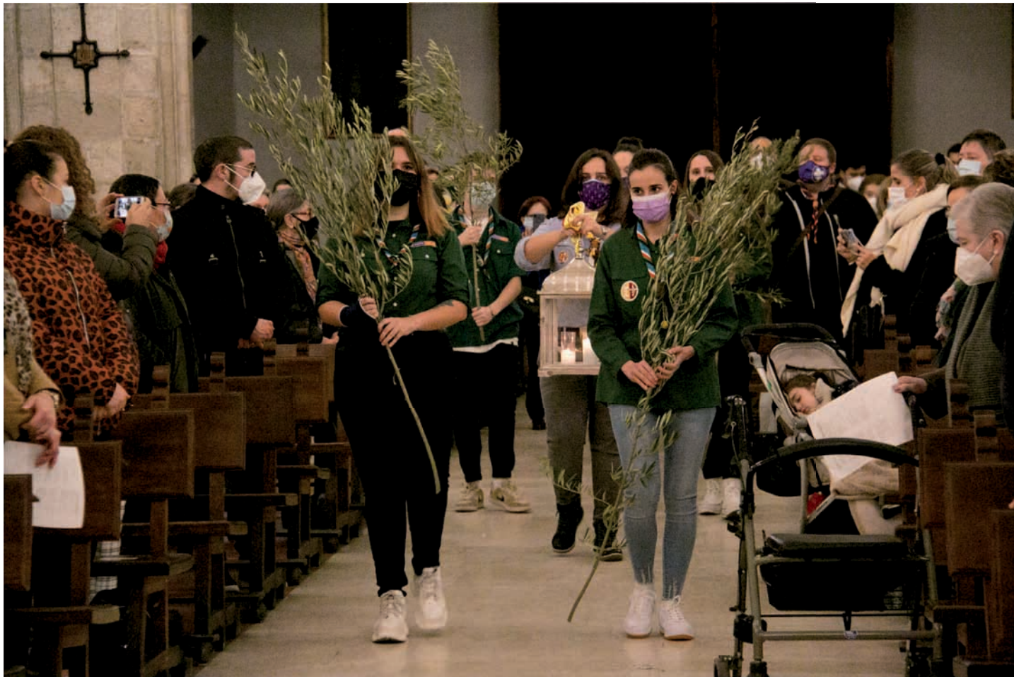
Momento de la entrada de la Luz de la Paz de Belén en la Catedral el pasado 17 de diciembre

La Catedral acogió el pasado 17 de diciembre la entrega de la Luz de la Paz de Belén, la llama que los scouts encienden en el lugar del nacimiento de Jesús.