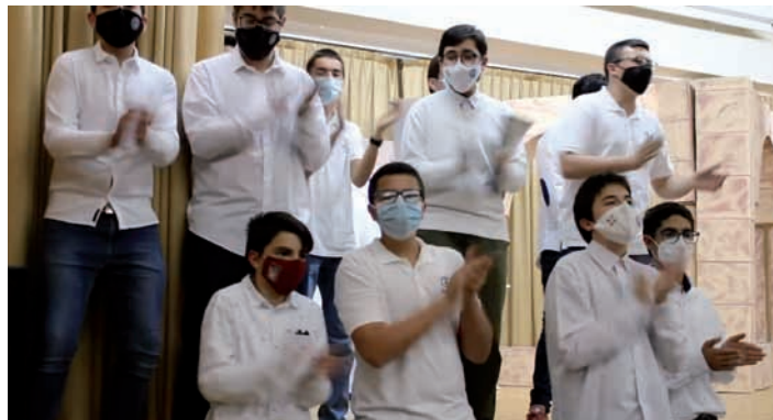
Navidad de 2020

De este modo, con pocos recursos y con comunidades con poco