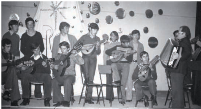
Navidad de 1978

Una historia que contar fue el título que los seminaristas dieron al festival con el que felicitan la Navidad a toda la diócesis.