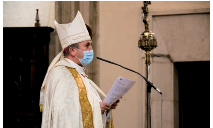
Un momento de la celebración de la entrega de la Luz de la Paz de Belén el pasado 17 de diciembre

Lo ideal sería que los sacerdotes solo celebraran una eucaristía al día, aunque se permite ampliar ese número debido tanto a la escasez de sacerdotes como a las circunstancias especiales en las que nos encontramos.