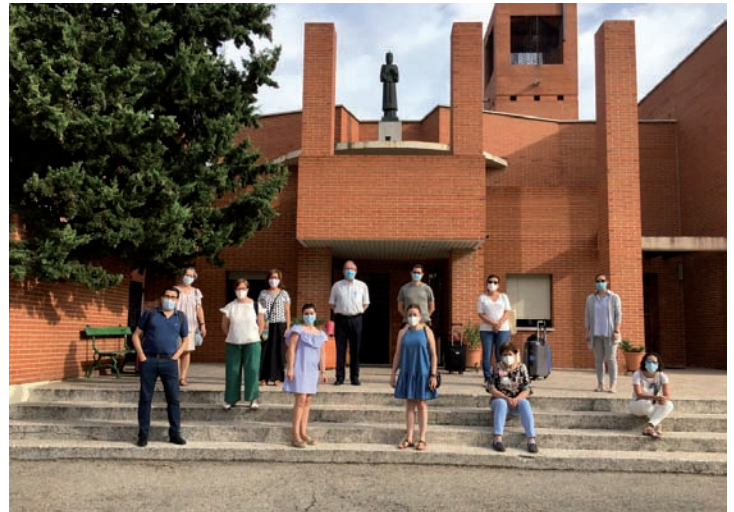
El grupo en la casa de Pozuelo

Ahora, durante el curso, se mantendrán los encuentros, con retiros de una jornada o de un fin de semana, aunque aún se está pensando el modo de proceder que se irá adaptando a las circunstancias sanita-