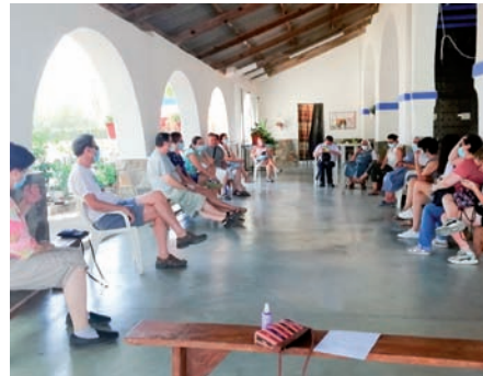
Un momento del encuentro, que se celebró en el exterior y guardando todas las medidas sanitarias necesarias