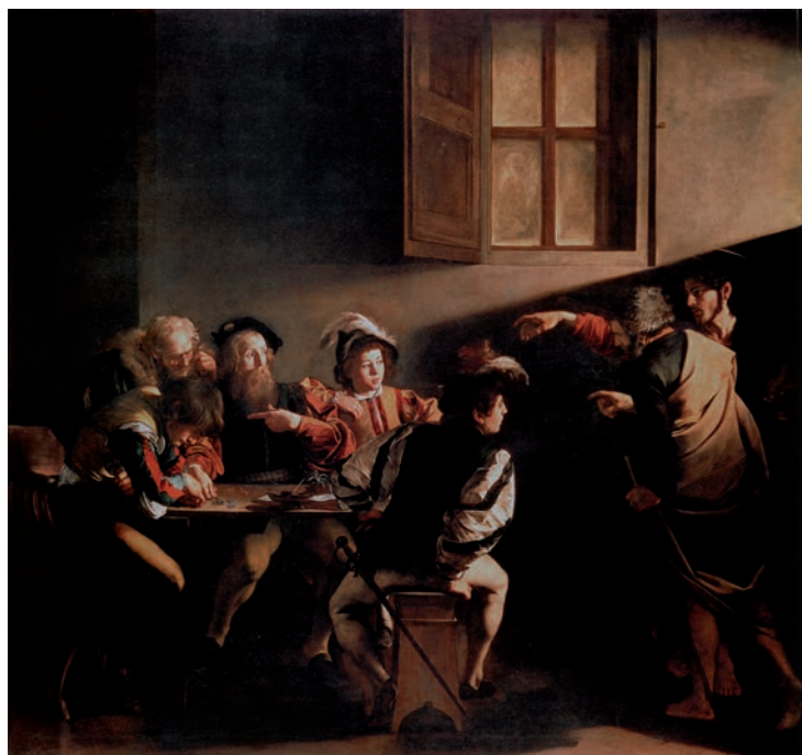
La vocación de san Mateo de Caravaggio es la imagen que ilustra la programación pastoral.

Porque descubrió que su vocación al sacerdocio era una llamada de Dios, no un deseo suyo. Es Dios el que le había elegido y por eso supo que si no apoyaba su ministerio en una fuerte relación con Jesús para sa-