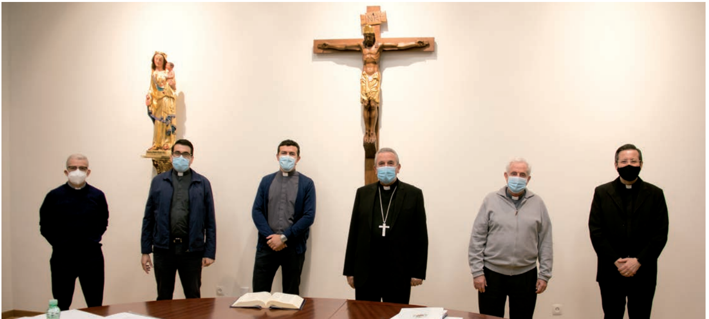
El pasado 29 de septiembre se reunió en el Obispado el Consejo de Gobierno con el obispo, don Gerardo Melgar.