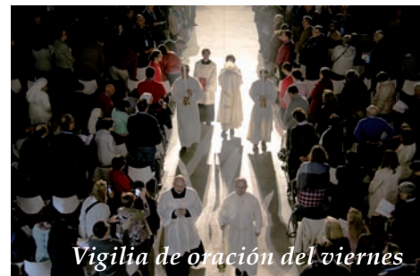
Vigilia de oración del viernes

En la página web de la diócesis: www.diocesisciudadreal.es está la crónica del congreso con acceso a todos los documentos y vídeos