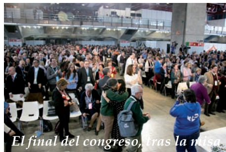
El final del congreso, tras la misa