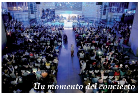
Un momento del concierto