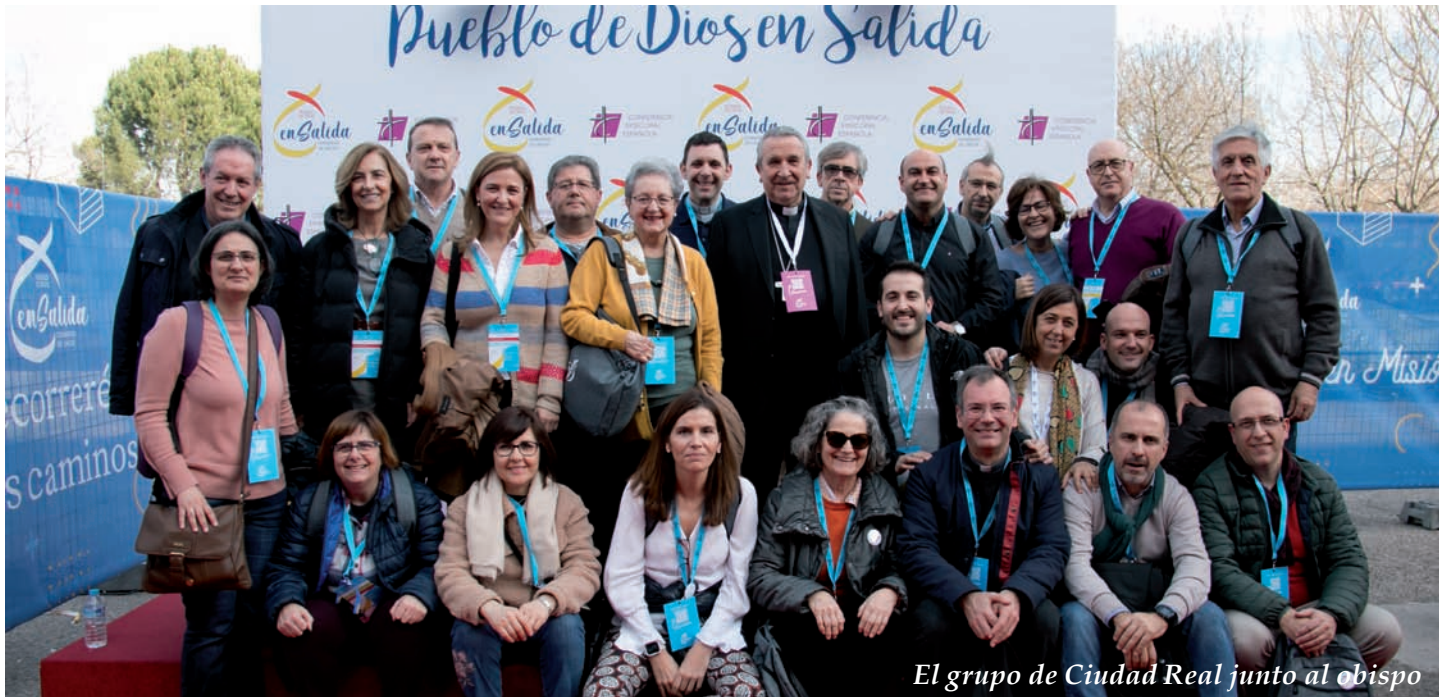
El grupo de Ciudad Real junto al obispo