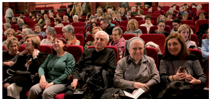
Amigos, voluntarios y miembros de Manos Unidas acuden cada año al Quijano para la presentación

Martínez insistió en el daño que hace a las personas la degradación del medioambiente, a su dignidad y a sus derechos. En esta línea, animó a todos los ciudadanos a consumir responsablemente, de manera que nuestros actos no perjudiquen aún más a los más pobres de la tierra: