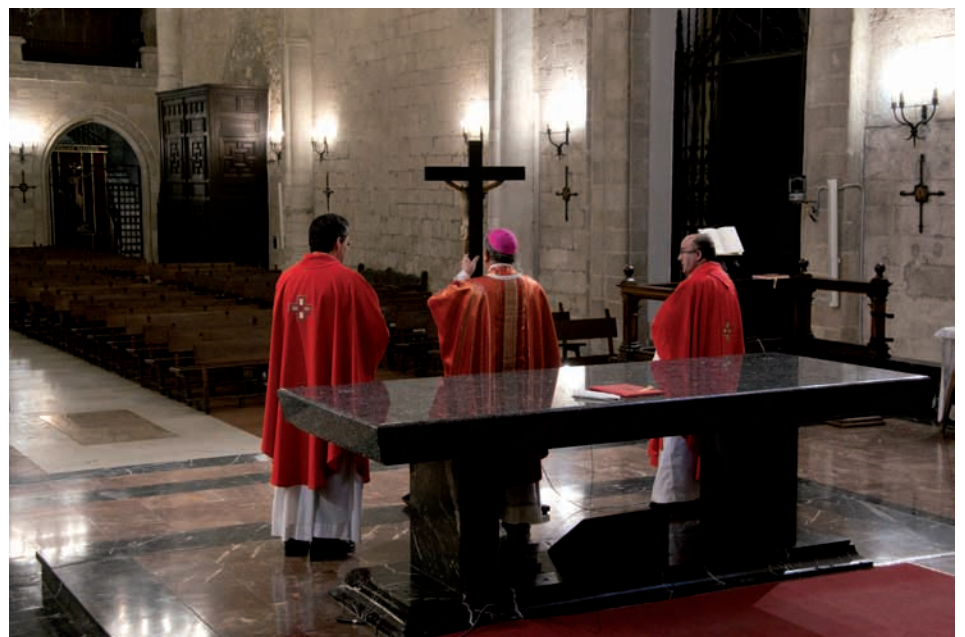
La adoración de la cruz en los oficios de Viernes Santo, con el obispo elevando la cruz en una Catedral vacía

Desde la primera misa que se emitió el 16 de marzo, el número de suscriptores de Youtube en el canal