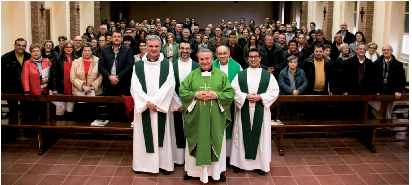
Foto de grupo del encuentro del 10 de febrero en el Seminario Diocesano, donde asistieron más de noventa personas

Tal y como hizo el pasado año, el obispo de la diócesis de Ciudad Real, monseñor Gerardo Melgar, se ha reunido en tres ocasiones con grupos de hermandades y cofradías. El 3, 10 y 17 de febrero, la casa de espiritualidad de Herencia, el Seminario y el pabellón municipal de Membrilla acogieron las reuniones en las que han participado este año casi 300 hermanos.