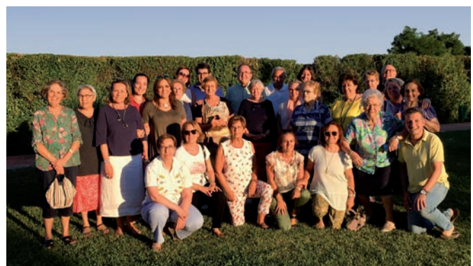
Parte del grupo al término de los ejercicios en la Casa de Espiritualidad Santa María de Nazaret, de Palencia, que regentan las Misioneras Eucarísticas de Nazaret

Durante este curso, en Quinta Asunción, se pondrán fechas de retiros de fin de semana y de un día para todos los que quieran participar.