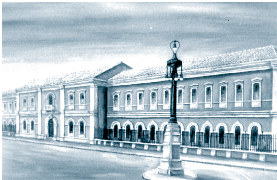
Dibujo de Luis Sandalio Corral: Antiguo Seminario de Ciudad Real

Es el regalo más gratificante que he podido recibir desde octubre de 1985 hasta Junio de 2010 como profesor-colaborador de dibujo, pintura y modelado, con todos aquellos jóvenes que con grandes ilusiones entraban en nuestro Seminario, constantes en las clases y la forma de transmitir la luz, a través de sus manos creadoras. Sus dibujos, esculturas y vasos de arcilla con la espontánea sencillez de la perfección, hablan a la vista con palabras de colores, en gozosa conversación, otras veces con el silencio, por arte y magia de esas manos, una evocación en las retinas, presente para siempre en la magnitud del esfuerzo y del trabajo de estos jóvenes que nunca olvido.