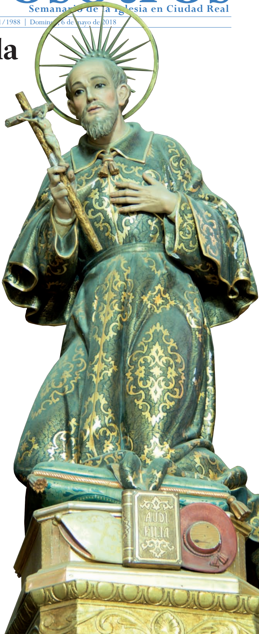
Imagen de san Juan de Ávila que se encuentra en el retablo de la capilla del Santísimo en la Catedral de Santa María del Prado, Ciudad Real.